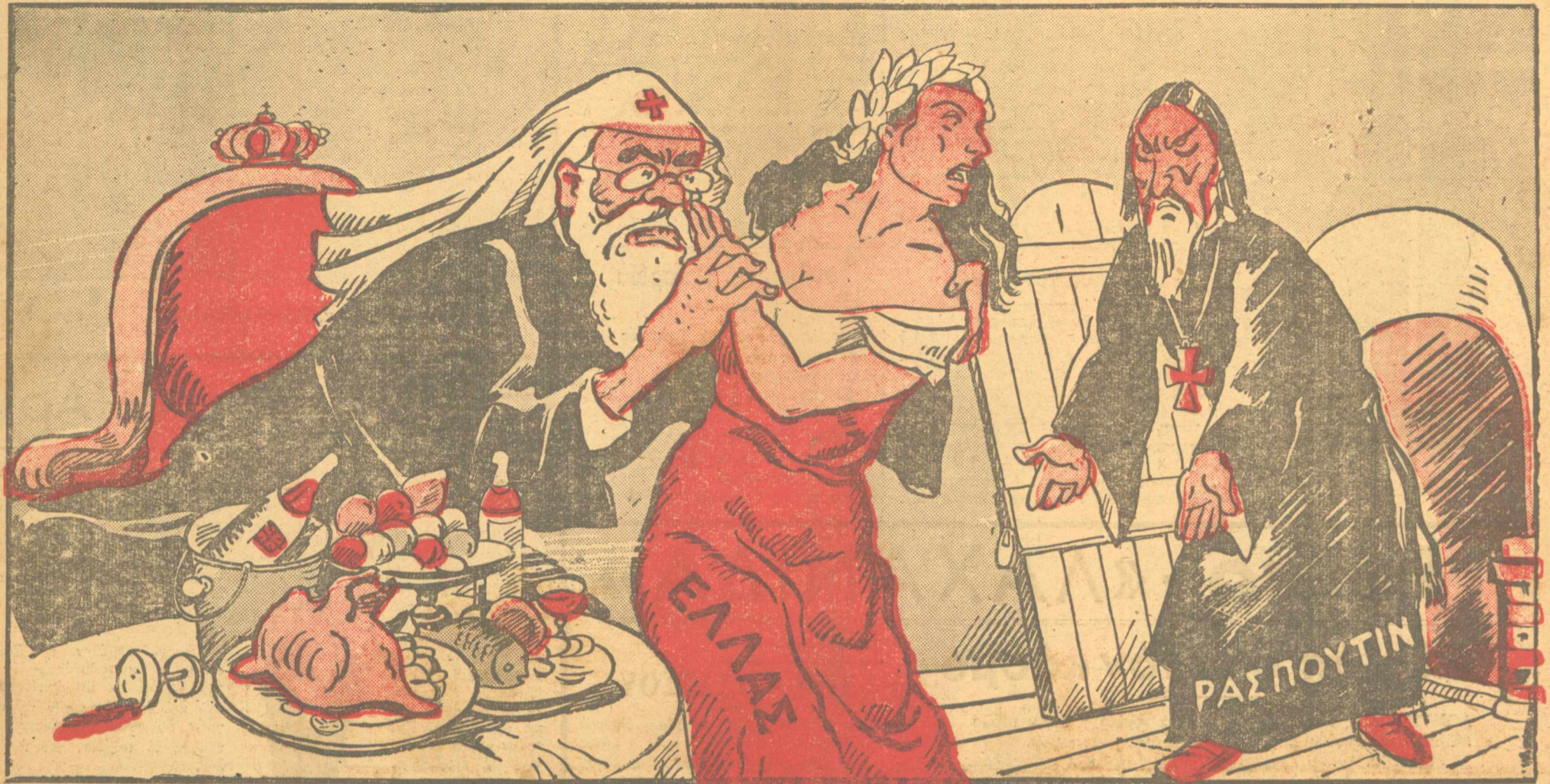
Ο ΡΩΣΣΟΣ ΡΑΣΠΟΥΤΙΝ! Άδερφέ μου, σε θαυμάζω. Έσθ' με ξεπέρασες. Άλλά πρόσεξε, γιατί εμείς οι ρωσοφόροι φέρνουμε στα καθεστώτα μας γρουσουζιά:...