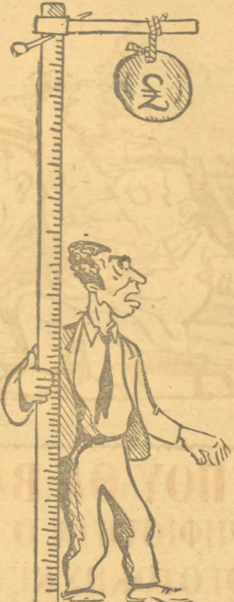
ΛΑΟΣ. — Όλο τὰ μέτρα που παίρνουμε, μὰ τὸν μετρητὴ τὸν κρίνουν στὴν...κορφή!...