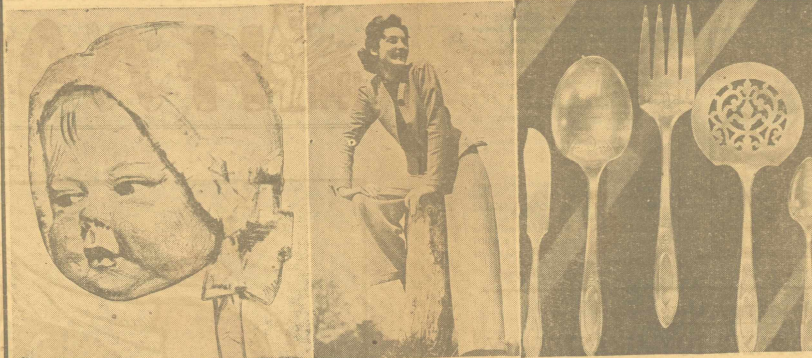
Μία κυρία τοῦ Κολωνακίου ποὺ ἔχει τὴ συνήθεια νὰ πηδᾷ πολλὰ παλούκια. Ἀπὸ τίς δηλώσεις τῆς Κυβερνήσεως: «Τώρα ὁ λαὸς θὰ φάη μὲ χρυσὰ κουτάλια».