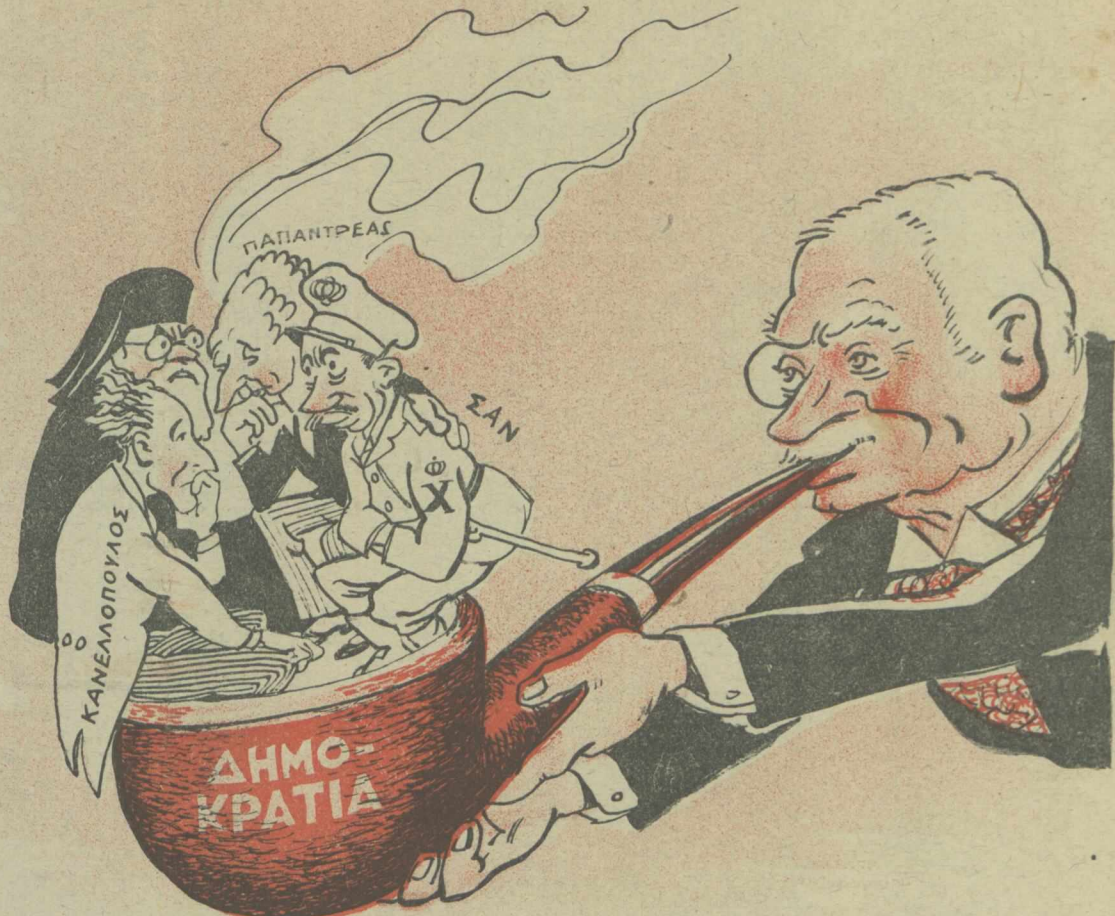
Κύτταξε τριγύρω οι μάγκες κάνουν τώρα τουμπεκί!...

— 'Ανακαλώ: — Ζήτω, Ζήτω ο Παπανδρέου! — Ζήτω ο Τσάτσος!