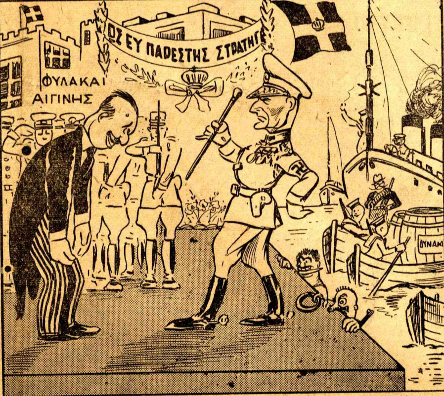
Ο ΔΙΕΥΘΥΝΤΗΣ. — Τί καλά μάς φέρετε, στρατηγέ από την Άθήνα; ΛΑΜΠΟΥ. — Δύο τόνους δυναμίτη και όχτακόσες χειροβομβίδες.