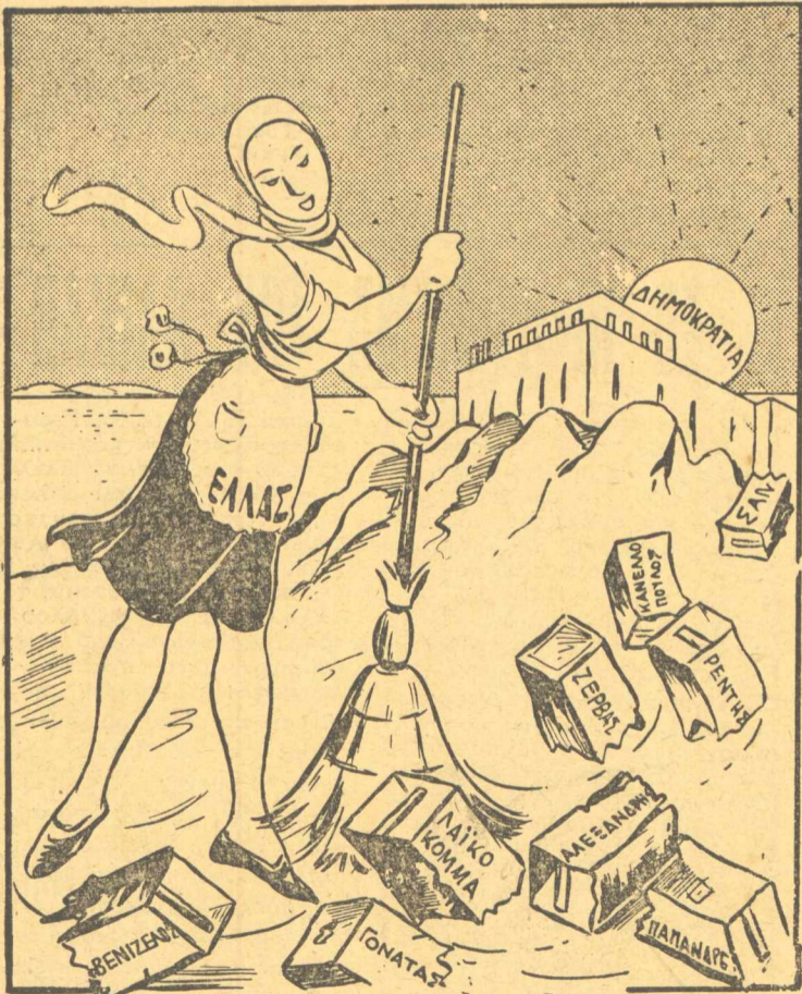
Η ΝΟΙΚΟΚΥΡΑ. — Ξημερώνει Καθαρή Δευτέρα, άς καθαρίσω τὸν τόπο από τούς παληοτενεκέδες...