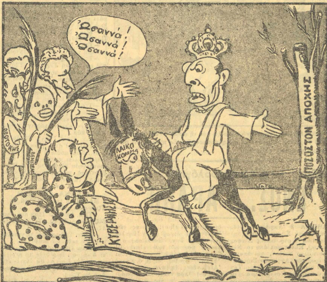
— "Ελα λοιπόν, Μεσσία και σε περιμένουμε ! — ΓΑΥΣΜΠΟΥΡΓΚ.— Πώς νάρθω μωρέ ; Δέν βλέπεις ότι εκάλωσε ή ούρα του γαιδάρου και δέν πρεχουρεί ;...

— Τόν σηκώνει κύριε Μπέβιν. — Δέν τόν σηκώνει. — Τόν σηκώνει ! — Άν λέτε σεις ότι τόν σηκώνει κι' επιμένετε νά τόν φέρετε, τότε θά με πάρει και θά με... σηκώσεται κι' έμένα μεθαύριο στο Παρίσι ! — Γιατί, κύριε Μπέβιν ; — Ξεχνάνε ότι μεθαύριο θά συναντηθούμε στο Παρίσι οι 4 όπουργοί των Έξωτερικών ; — "Ε, κι' έπειτα ; — Ρωτάτε, γιατί δέν γνωρίσα- τε τόν... Βισόνσκυ ! Έγώ όμως πού τόν έγνωρίσα, κάτι ξερω πε- ρισσότερο από σας. — Μά ξερχεται τό Πάσχα κύριε Μπέβιν. Κι' έμεις λογαριάζαμε νά ξεχουμε έδω τόν βασιλιά για νά τσουγκρισουμε μαζί τ'ούγά μας. Τώρα τί θά κάμουμε, κύριε Μπέβιν ; — Θά κάτσετε... σ' τ' αυγά σας ! "Η καλλίτερα τσουγκρίστε τα μεταξύ σας. Και πράγματι από προχθές έχουν άρχισει νά τ' σ ο υ γ - κρίζουσι οι Λαϊκοί με τό Τρίο Κι' ο Λσός τί κάνει ; Μένει άγρυπνος, αλλά κι' άπαθής. Κυτ- τάει τούς δεξιούς και τούς λέει : — Θέλετε νά φέρετε τόν βασι- λιά σας ; Όρίστε. Φέρτε τον ! "Εγώ θά τόν υποδεχθώ όπως πρέπει. — Δηλαδή πώς τόν υποδεχθείς ; ρωτήσανε οι δεξιοί. — Μετά β'των και κλάδων. Έ- χω από τώρα έτοιμάσει τόν... κλάδο. Τόν βλέπετε ; Και τούς δείχνει μιά... κλάρα μεγάλης άντοχής! Η «ΛΑΧΑΝΙΔΑ»