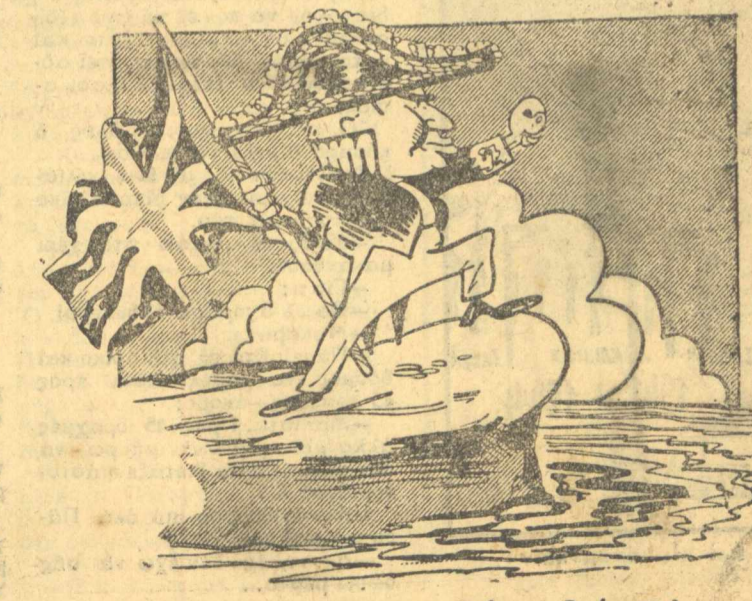
—ΛΟΝΤΙΝΟΣ (Υπουργ. Έξωτερ.): Τρέμε ... Βιοίνου!

κλογικό τμήμα μάς άλλης κυριας, προτεινάμε τήν ψηφοφορία και μετά τήν δύσιν τού ήλιου. Αϊ κυριαί μάς διαβεβαίωσαν ότι ή ψηφοφορία μας δέν θάχει καμμίαν συνέπειαν και ότι τώ άποτέλεσμα θά είναι γνήσιον. Άλλ' αν τυχόν προκόψει καμμία συνέπεια και δέν προλάβει κάποια από τίς κυρίες γ' απαλλαγεί τών συνεπειών, τότε τώ άποτέλεσμα θά είναι...ν ο θ ο ν! Οι παρατηρηται Γζών, Μπίλλυ και Σάμ ΥΣΤΕΡΟΓΡΑΦΟΝ.— Τήν ήμέραν τής 31ης Μαρτίου έμάθομεν εκ φήμης, ότι έγιναν εις τήν Έλλάδα και βουλευτικά έκλογα. Δέν έφρονίσωμεν όμως να εξακριβώσωμεν τήν φημην αυτήν, δηλαδή αν πράγματι έγιναν βουλευτικά εκλογαί, διότι τώ ζητημα τούτο δέν είναι τής άρμοδιότητός μας. ΟΙ ΊΒΙΟΙ