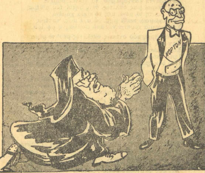
ΜΑΚΑΡΙΩΤΑΤΟΣ: Μην... άπολύεις τόν δούλο σου.. Δέσποτα!