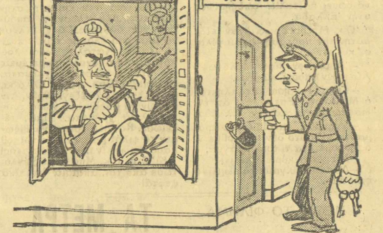
ΑΙΝΙΓΜΑ «Κλειδώνω μανταλών τόν χιτή άφήνω μέσα» !!!