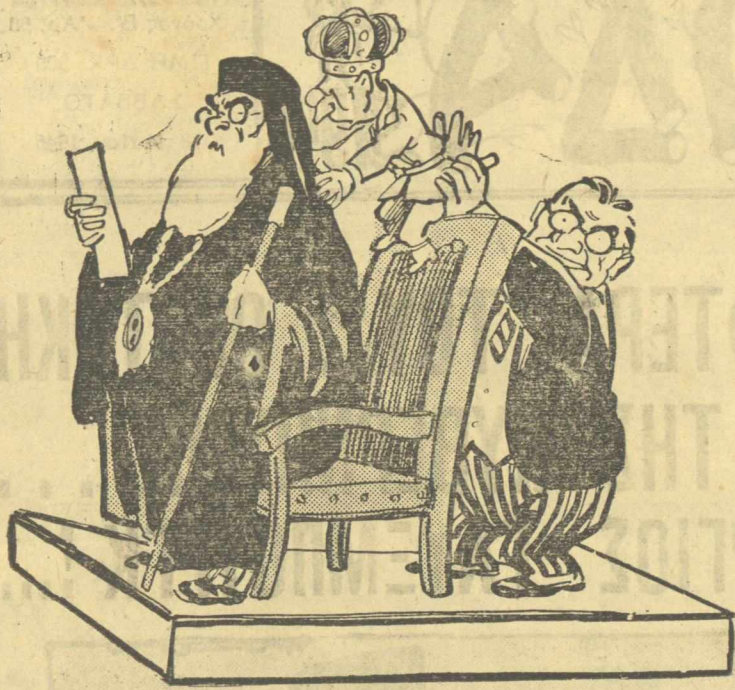
Ο λογος του θρόνου I...