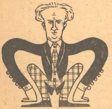
Ἀπὸ τὴν κορφή ὡς τὰ νύχια!