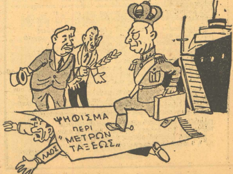
Γιά ποιόν λόγο έγινε τόν ψήφισμα