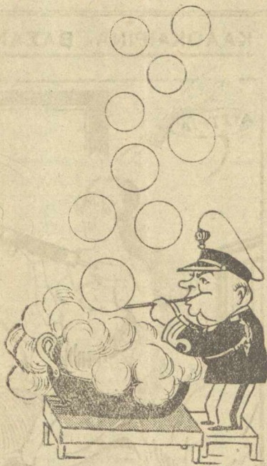
Ο κ. Πρωθυπουργός... αναπτύσσων το κυβερνητικόν πρόγραμμα