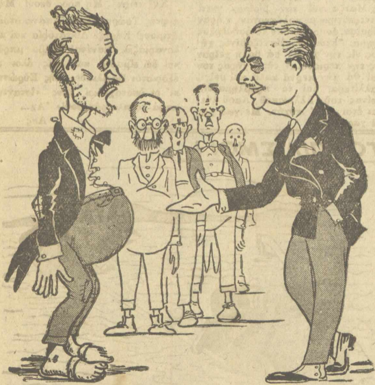
ΔΗΜ. ΥΠΑΛΛΗΛΟΣ—Πεινάμε, κόριε 'Υπουργέ! ΜΑΝΤΖΑΒΙΝΟΣ—Μά εγώ βλέπω τό στομάχι σου παραφουσκωμένο! ΔΗΜ. ΥΠΑΛΛΗΛΟΣ—Παραφούσκωσες... από τισ όποσχέςσεις ίσας, κόριε 'Υπουργέ!