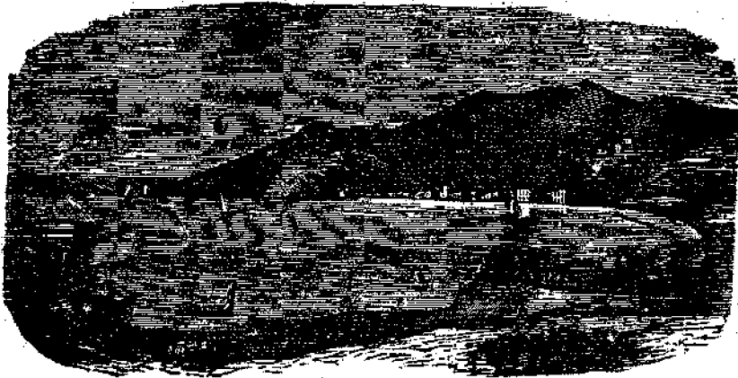
Ἡ νῆσος Πάτμος