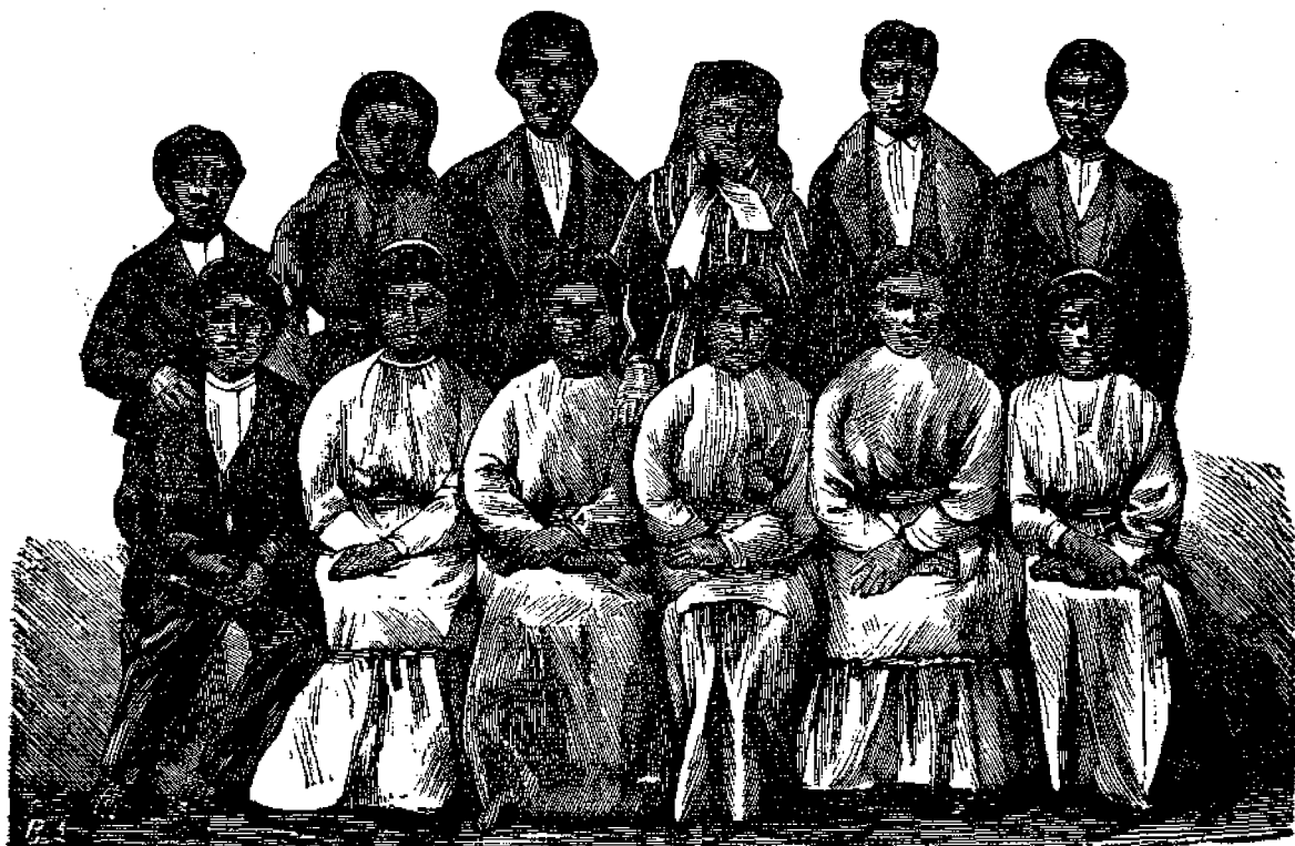
Παῖδια καὶ κορῆσια ἀγρίων ἀμερικανῶν ἐκ Κυριακῶν τι σχολείου.

Ἐδοχῶς εὐρέθησαν καὶ μεταξὺ τῶν Εὐρωπαίων ἀποίκων ἀνθρώποι εὐσεβεῖς, οἵτινες ἐζήτησαν ἀφιλοκαρδῶς τὸ καλὸν τῶν ἀγρίων ἐκείνων τῆς ἐρήμου καὶ διὰ τῆς ἀγίας αὐτῶν ζωῆς ἔδειξαν, ὅτι ὁ χριστιανισμὸς εἶναι τῷ ὄντι θρησκεία θεῖα καὶ ἔχει τὴν δύναμιν νὰ μεταποιῇ τὸν ἄνθρωπον εἰς ἀγιον