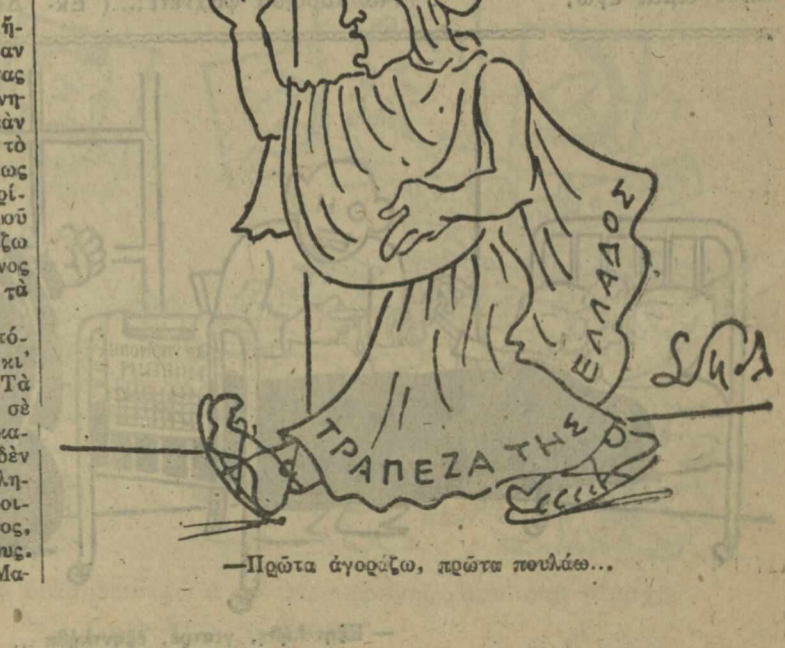
—Πρῶτα ἀγορεύει, πρῶτα πούλωσε...

Μουσιχὴ: ΓΙΑΝΝΑΚΟΠΟΥΛΟΥ Τραγοῦδι: ΚΑΝΟΝΙ