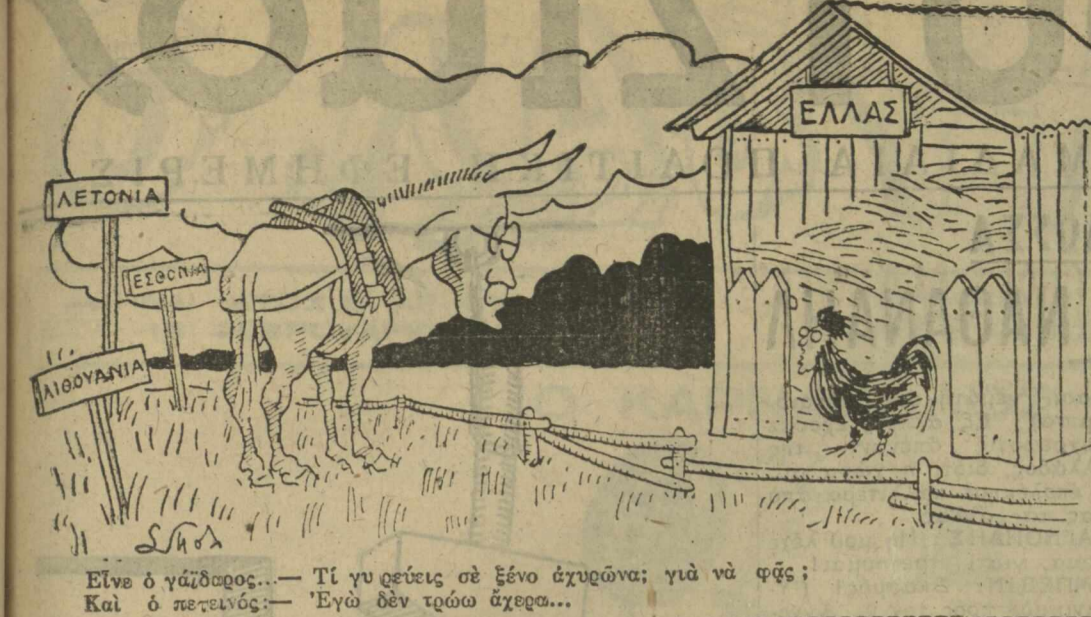
Εἶνε ὁ γάβρος... Τὶ γὰρ εἶπες σὲ ξένο ἀχρεῖνα; γὰρ νὰ φῆς; Καὶ ὁ πετεινός... Ἐγὼ δὲν τρώω ἀχρεῖνα...