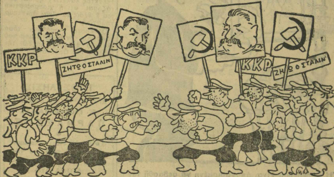
Σύγκρουσις μεταξύ δύο διαδηλώσεων άντιθέτων φρονημάτων στη Μόσχα "Η: Νταραβέρι νά γίνεται