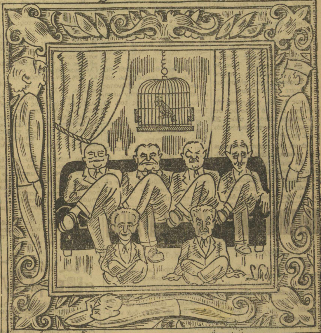
Ἡ ΝΕΑ ΚΥΒΕΡΝΗΣΙΣ ΣΥΝΑΣΠΙΣΜΟΥ ΣΗΜ.— Ἄνω εἰς τὸ μέσον διακρίνεται ὁ Πρόεδρος τῆς Κυβερνησεως κ. Πουλτσα.

Ἐμνήθη προφανῶς ὁ τὸν λαὸν μας βασανίζων καὶ ἡ «γραφὴ» ὀρχίζεται: «Ἄδικεῖ Δαμασκηνός Θεὸν γὰρ οὐ νομίζων δὲν ὁ λαὸς νομίζει, ἀρέσκειται ἀνευ ἐλέους νὰ μὰς παίζῃ τὸν Παπᾶ... Ἄδικεῖ δὲ καὶ τοὺς νέους... καὶ λοιπά!...»