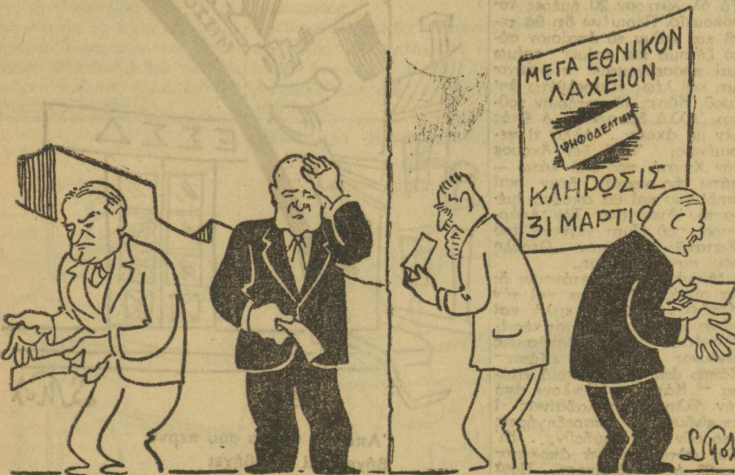
Ο ΚΑΘΕΝΑΣ ΧΩΡΙΣΤΑ: — Κόττα άτυχία! Νά κερδίσω τόν πρώτο αριθμό και νά μήν έχω όλόκληρο λαχείο αλλά τέταρτο....