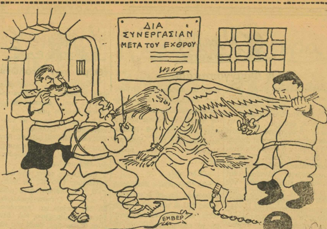
Η ΝΚΗ, την όποιαν σήμεραν έρτάζουν εις τό Λονδίνον...

ΠΟΛΟΙ ΒΟΥΛΕΥΤΑΙ : (Κτυπώντες τόν γρόνθον της δεξιάς χειρός τους εις την