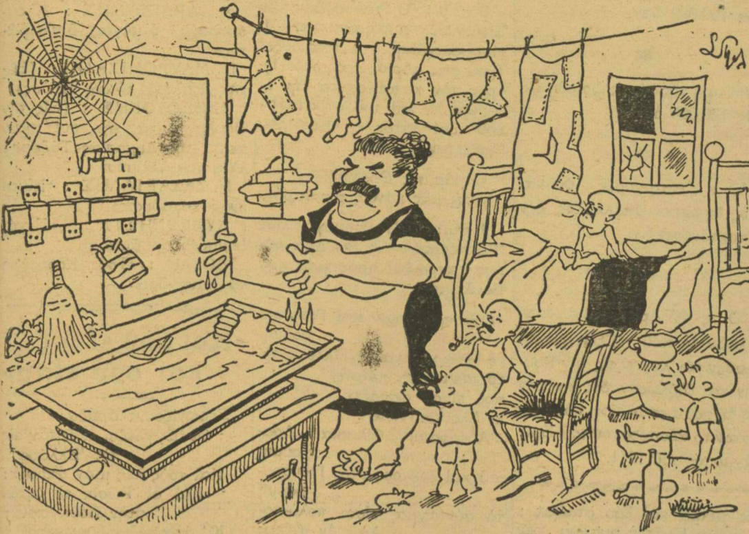
— Καλά θάταν νά πήγαινα. Άλλά θά πρέπει έπειτα νά τον καλέσω κι' έγώ, και ποδ νά τον βάλω; ..

Ο Τρούμαν έκαλεσε δύο φορές τον Στάλιν στην Αμερική