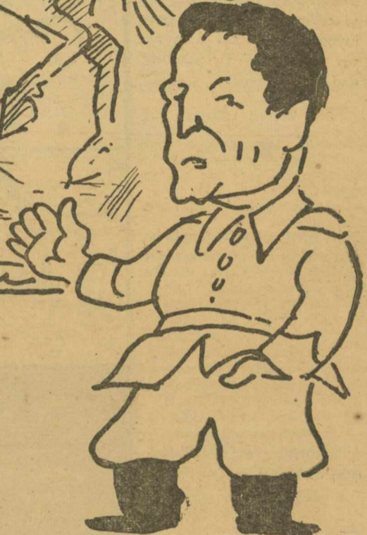
Ο ΤΙΤΟ: —Νὰ πὼς κατεπιέζαν ἀνέκαθεν οἱ μοναρχοφασίστες Ἕλληνες, τὸν Σλαβομακεδονικὸ λαὸ τῆς Θεσσαλονίκης.

Ἐν ἀρχῇ ἔλαβεν τὸν λόγον ὁ Πρωθυπουργὸς κ. Κ. Τσαλδάρης, ὅστις ἀπευθυνόμενος πρὸς τὸν κ. Ν. Ζέρβαν εἶπεν: —Καλὸ τσανακί εἶσαι καὶ τοῦ λόγου σου! —Ἐμένα τὸ λές; εἶπεν ὁ κ. Ζέρβας. —Ἐσένα τὸ λέω!, ἀπήντησεν ὁ κ. Τσαλδάρης. Κατόπιν τούτου ὁ κ. Ζέρβας, ἐξῆλθε «τῆς συσκέψεως θογγίλος»—καθὼς ἐγράφη εἰς τὰς ἐφημερίδας—καὶ οὕτω οἱ παριστάμενοι εἰς τὴν σύσκε-