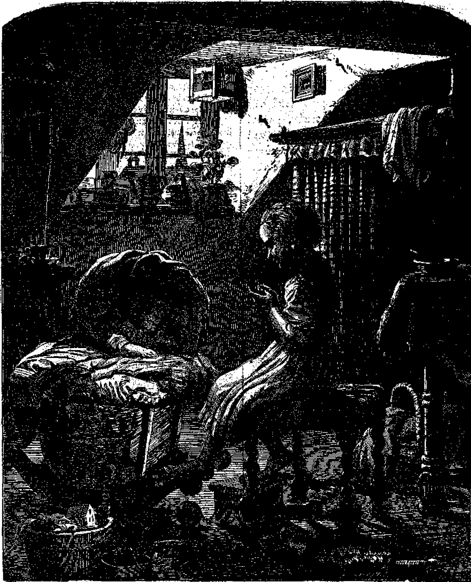
Ἡ μικρὴ Μαργαρίτα καὶ ὁ ἀδελφός της.

γνώσται, τὴν προκειμένην εἰκονογραφίαν εἰς αὐτὴν περιστάται μέγα δαμάτιον οἰκίε με δίδωρα οἰκιακὰ ἐπιπλα, ἀλλ' ἐκείνο, τὸ θεατὸν θέλει τὴν δρασιν καὶ συγχρόνως συγχίνει τὴν καρδίαν τοῦ θεατοῦ εἶναι τοῦτο, ὅτι νήπιον