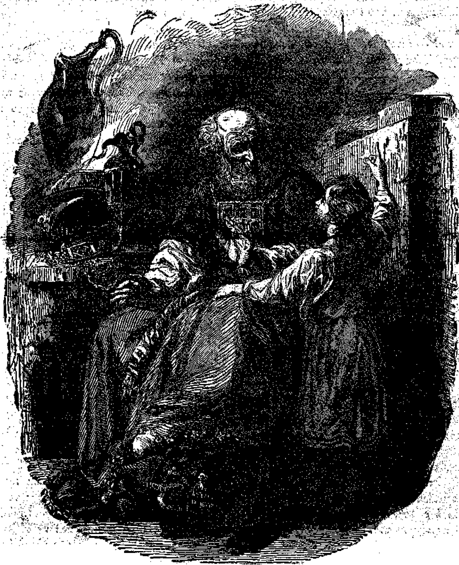
Ὁ γέρον Ἡλεὶ καὶ ὁ μικρὸς Σαμουὴλ.

Ἡ ἱστορία τοῦ Σαμουὴλ μᾶς διδάσκει διὰ φορα ὥρατα μαθήματα ὅθεν προτρέπομεν πάν- τας τοὺς μικροὺς μας ἀναγνώστας νὰ ἀνοίξωσι τὴν Ἁγίαν Γραφὴν καὶ ν' ἀναγνώσωσι τὸ Πρῶ- τον καὶ Δεύτερον Βιβλίον τοῦ Σαμουὴλ, ὅπου εδείχεται ὅλη ἡ βιογραφία τοῦ μεγάλου ἐκεί- νου Κριτοῦ καὶ προφήτου.