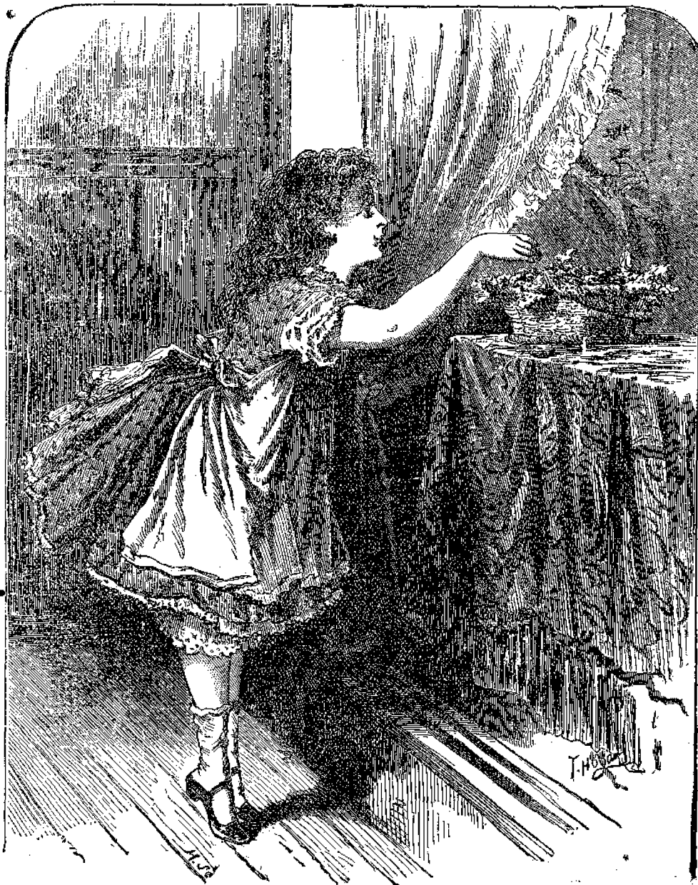
Ἡ Ῥόζα καὶ τὰ ὀπωρικά.

πρέπει νὰ τὰ ἐγγίξῃ.» «Ὁχι, πατέρα, δὲν θὰ τὰ πειράζω,»—καὶ ἡ Ῥόζα ἐξηκολούθει νὰ βλέπῃ εἰς τὸ ὠραῖον βιβλίον, τὸ ὁποῖον ὁ πάππος τῆ εἶχε χαρίσει. Ἄλλ' ὀσάκις ὕψανε τοὺς ὀφθαλμοὺς καὶ ἔβλεπε τὰ νόστιμα καὶ σπάνια ὀπωρικά περικυκλωμένα ὑπὸ φύλλων,