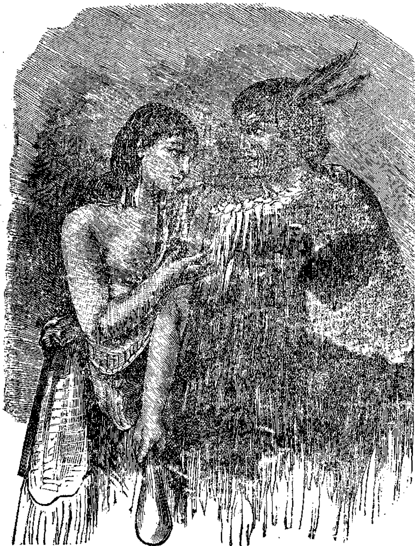
Ζηλιανδὸς ἀρχηγὸς καὶ ἡ γονὴ του.

Δυστυχῶς διὰ τὴν ταλαιπώρον ἐκείνην γυναῖκα ἡ ἀγάπη τοῦ αἰμοχαροῦς συζύγου τῆς ἐφθασεν εἰς τὸσον βαθμὸν διαστροφῆς, ὥστε διὰ νὰ τὴν ἔχη πάντοτε μαζί του ἀπεφάσισε νὰ τὴν φάγῃ! καὶ λοιπὸν τὴν ἐρόνευσε μίαν ἡμέραν καὶ τὴν κατέφαγε! Πόσον σκοτίζει, καὶ τυφλώνει τὸν νοῦν καὶ καυτηριάζει τὴν συνεί-