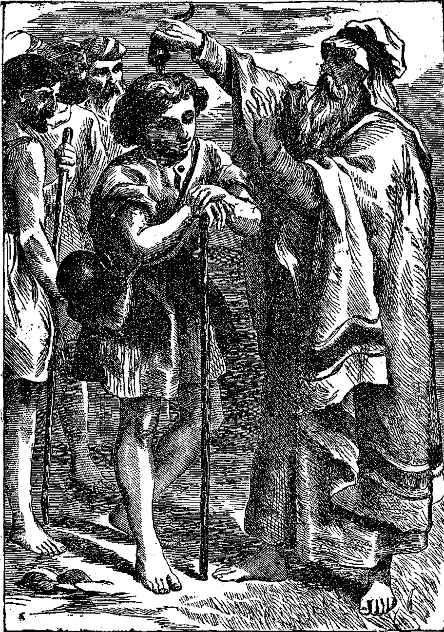
Ο Σαμουήλ χρίων τον Δαβιδ βασιλέα.

εκκλησίας και εν γένει του κόσμου. Ήτο δε άνηρ έξόχων φυσικών και επίκτητων άρετών, ώρατος και γλυκός την ύψιν, γενναίος δε και άτρόμητος την καρδίαν, καρτερικός εις τους πόνους και τας κακουχίας, επιχειρηματίας δε και τολμαρός εις τους