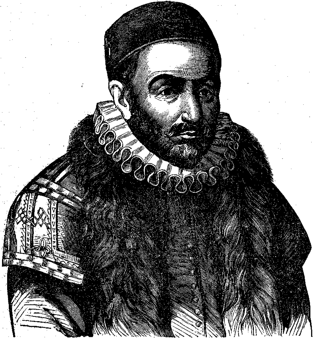
Γουλιέλμος ὁ σιωνιτὸς

Ὡς στρατηγὸς ἦτον ἀπαραμίλλος, ἐνῶ διὰ τὴν διπλωματικὴν αὐτοῦ ἐμπειρίαν ἐθαυμάζετο ὁ