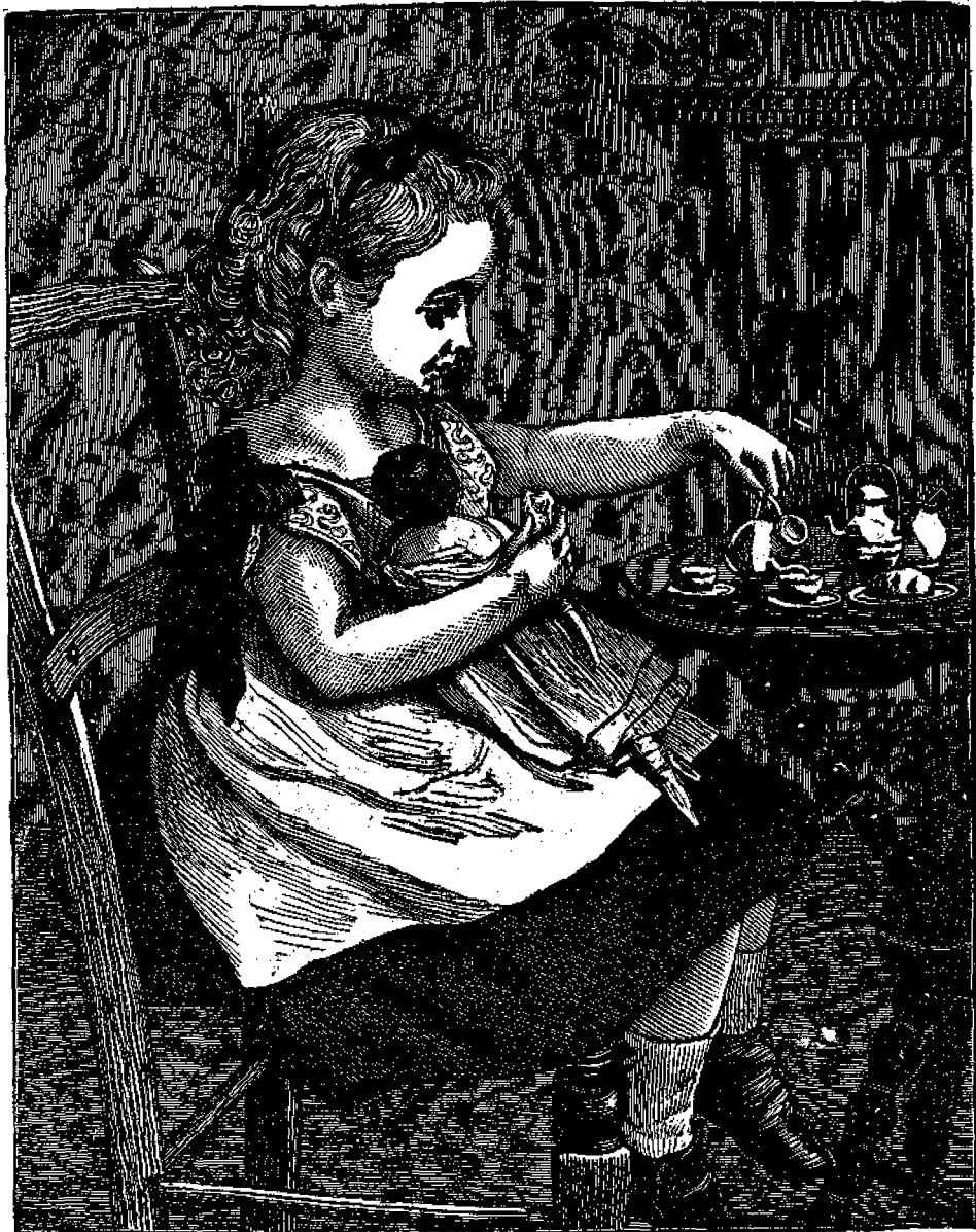
Ἡ Μικρὰ Ἀγγαία καὶ τὸ τσάι της.

Και όμως εκατομμύρια εκατομμυρίων ανθρώπων προσκυνῶν αὐτὸ εἰς τὰ μεσημβρινὰ τῶν Ἰνδιῶν. Δὲν ὑπάρχει χωρίον, δὲν ὑπάρχει ἀγρὸς, δὲν ὑπάρχει ὄρος, ἐπιὸ θεὸς οὗτος νὰ μὴ ἔχη ναῖδιον. Λατρεύεται δὲ ἰδίως ὡς θεὸς τῶν χωρίων καὶ τῶν ἀγρῶν ὑπὸ τὸ ὄνομα Κέριος, καὶ μυριάδες ἀναθημάτων προσφέρονται καὶ ἄς 100 χιλιάδας τῶν ἐσκοτισμένων τούτων ἀδελφῶν μας καὶ νὰ φέρουν αὐτοὺς εἰς τὸν Χριστιανισμόν. Ἐλπίζεται δὲ ὅτι σὺν τῇ χρόνῳ καὶ τῇ εὐλογίᾳ τοῦ Θεοῦ ὁλόκληρος ὁ μέγας ἐκεῖνος πληθυσμὸς τῆς Ἰνδίας θὰ προσέλθῃ εἰς τὸν Χριστὸν καὶ αὐτὸν θ' ἀναγνωρίσῃ Κόριον.