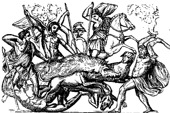
Ὁ Καλυδώνιος Κάπρος.

Εἰς οὐδένα, ἐκτὸς τῶν τακτικῶν αὐτῆς ἀναποκριτῶν, στέλλεται ἡ 'Εφημερίς τῶν ἀλλοθῶν ἢ ἄλλῃ προκληρωμῆς.