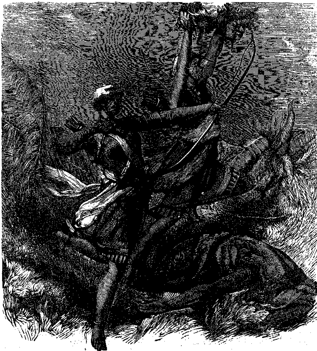
Ἀμαζόνες τῆς Δαχόμης.

κῶν του. Ἡ Δόμη καὶ αὐτὸς ὁ πρωθυπουργὸς του δὲν δύνανται νὰ τὸν πλησιάσῃ χωρὶς νὰ πέσῃ ἐπὶ τῶν γονάτων του καὶ νὰ κολίσῃ τὴν κεφαλὴν του εἰς τὸ χῶμα! ἔχει δὲ στρατὸν πολλὸν καὶ ὡς τὸν ἑαυτὸν του σκληρὸν.