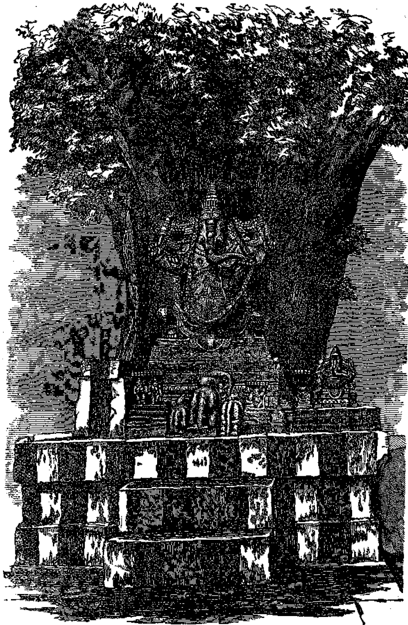
Ἄγαλμα τοῦ Βούδα.

Ἐξήμεροῦται εὐκόλως και δεικνύει πολλὴν ἀγάπην εἰς τοὺς φύλακας και πρὸς πάντας τοὺς περιποιημένους αὐτήν.