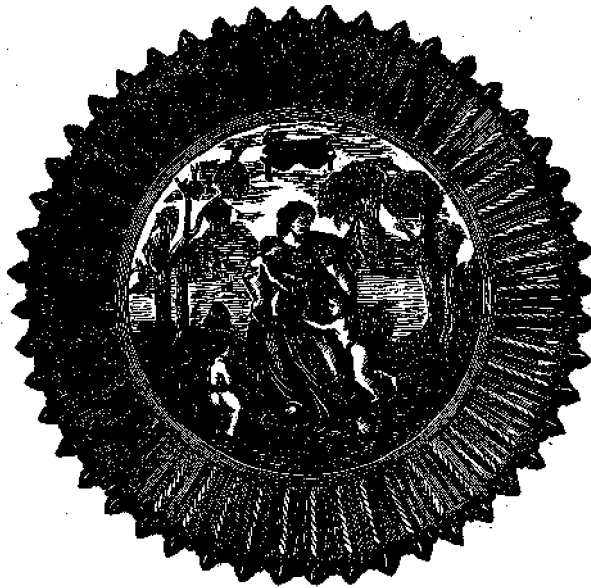
Ἄγγειον κατασκευασθὲν ὑπὸ τοῦ Παλισίου (Ἰδὲ προηγουμένον φύλλον.)

Ὅποια τρομερὰ ἀπάτη! καὶ ὅμως περὶ τὰ 150 ἑκατομύρια ψυχῶν οὕτω πιστεύουσι καὶ οὕτω ζῶσιν