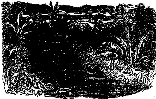
Ἰσὸς ἀράχνης ὑπεράνω ποταμοῦ.

Ἡ Σαπφὴ ἔγραψε πρὸς αὐτὸν καὶ πολλοὺς ὕμνους πρὸς τοὺς θεοὺς, οὐδαὶς ἐκ τῶν ὑποῶν ὕμνος διεσώθη μέχρις ἡμῶν. (Ἐκ τοῦ Ἀοτίρου τῆς Ἀνατολῆς.)