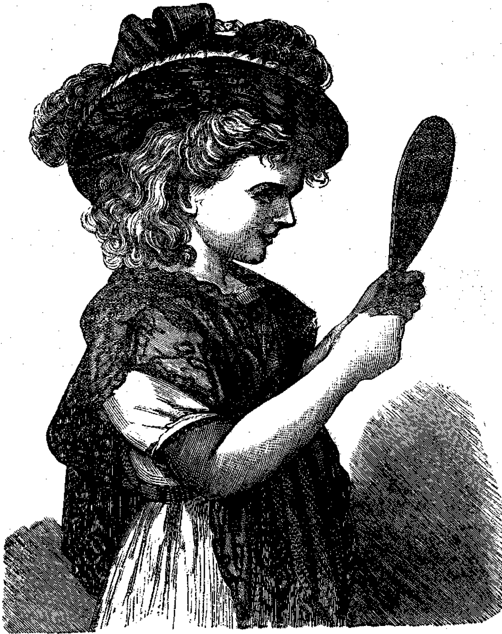
Ἡ κλῆρα καὶ ἡ καθρέπτης της.

Ἡ παροῦσα εἰκὼν παριστᾷ πρόσωπον φαντασιῶδες,