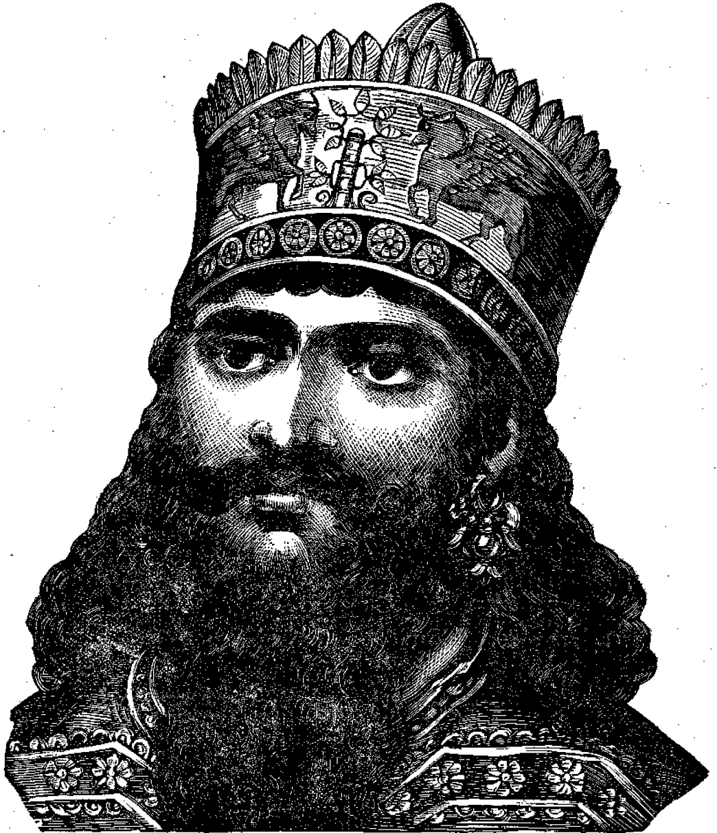
Ναβουχοδονόσορ ὁ βασιλεὺς τῆς Βαβυλώνας.

Αὐτὸς εἶναι ὁ Ναβουχοδονόσορ, δεῦτε εἶδε τὸ ἐνύπνι-