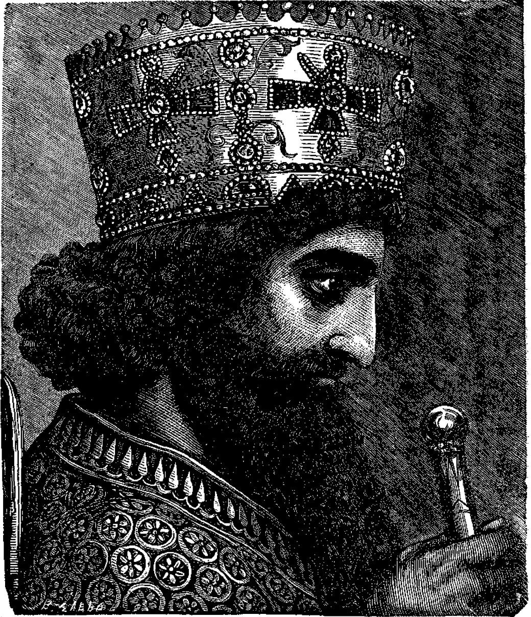
Ἀσσοῦρος ὁ μέγας βασιλεὺς τῆς Περσίας.

Εἰς τὰς ἀλλοιότητους ταύτας πράξεις τοῦ Ἀσσοῦρου, ὁ ἀπλοῦς ἱστορικός δὲν βλέπει ἐμῆ ἀπλήρῃ ἰδιοτροπίαν, ἐκ τῶν ἀποτελεσμάτων ἡμῶς κρίνοντας, βλέπομεν, ὅτι ἢ ἐπὶ πάντων τῶν ἐγκοσμίαν ἐφορεύουσα θεία Πρό-