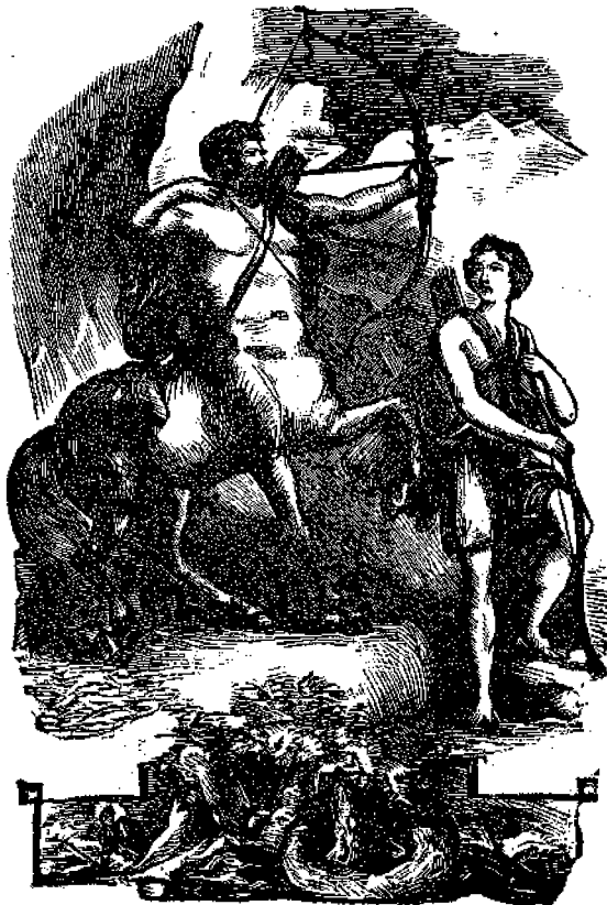
Χείρων ο Κένταυρος και ο Ιάσων.

Εις ουδεν, πλην των τακτικων αναποικιτων, πωλλεται η Εφημερις των παιδιων ενευ προπληρωση.