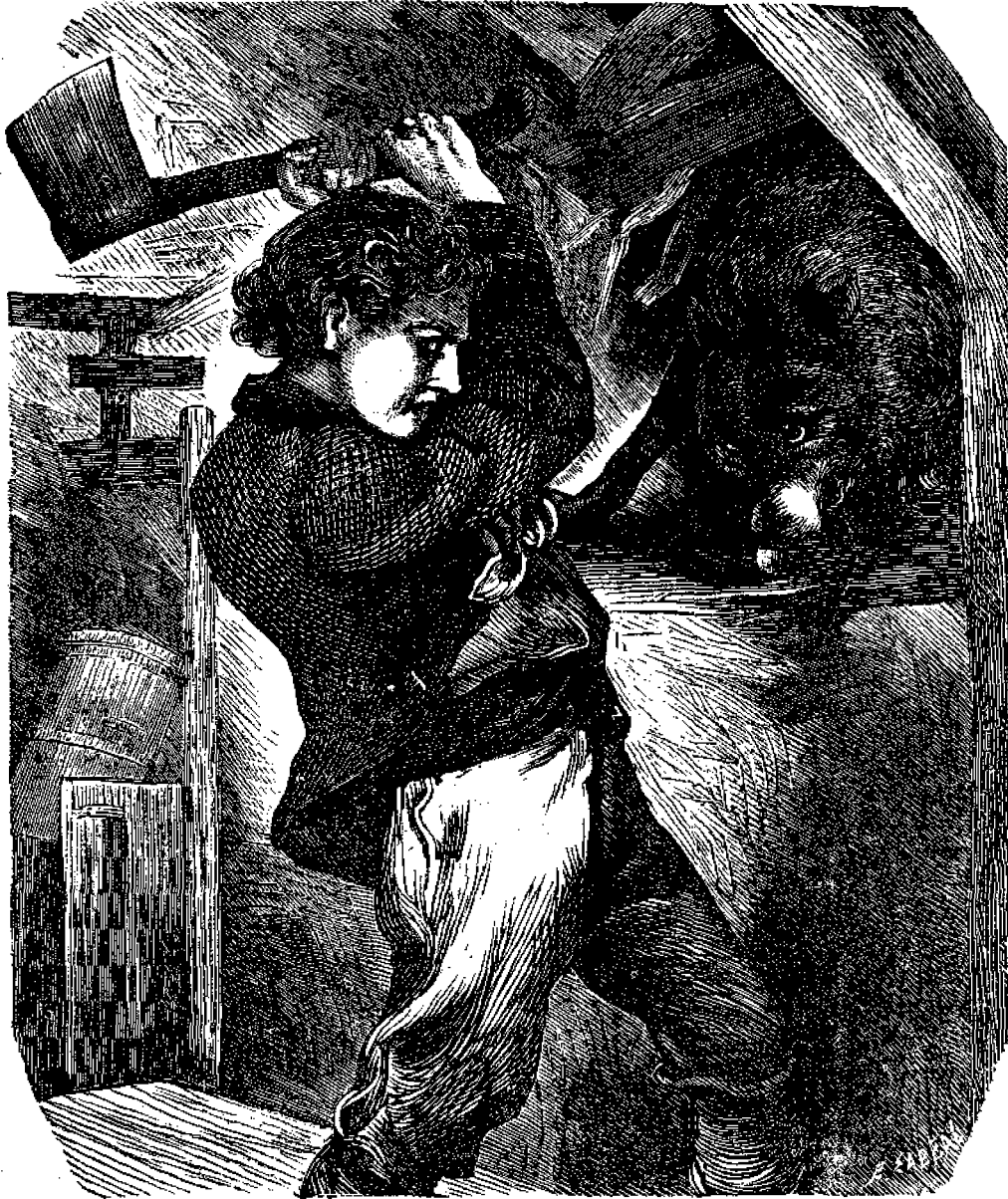
Ἡ πᾶλη τοῦ Ἰακώβου πρὸς τοὺς λύκους. (ἰδὲ ἐπομένην σελίδα.)

Ἄν ἦναι τις ἔξυκνος, μὴ τόν ζηλεύετε, ἀλλά μάλλον καταγίνεσθε μὲ περισσοτέραν ἐπιμέλειαν εἰς τὰ μαθήματά σας, ὅπως και σῆς μὴ φανῆτε κατώτεροι αὐτοῦ.