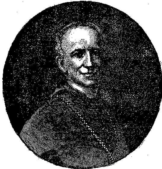
Πάπας Λέων ὁ 13ος.

Ὁ νέος Πάπας εἶναι προσέτι λιτὸς εἰς τὴν τροφὴν του καὶ οἰκονόμος εἰς τὰ ἔξοδα τῆς αὐλῆς του, οὐχὶ δὲ καὶ τὸσον ἐπίμονος ἕσον ὁ προκάτοχός του, εἰς τὰς ἀρχαίας ἀξιώσεις τῆς Παπασίνης. Κατὰ τὰ στατιστικὴν