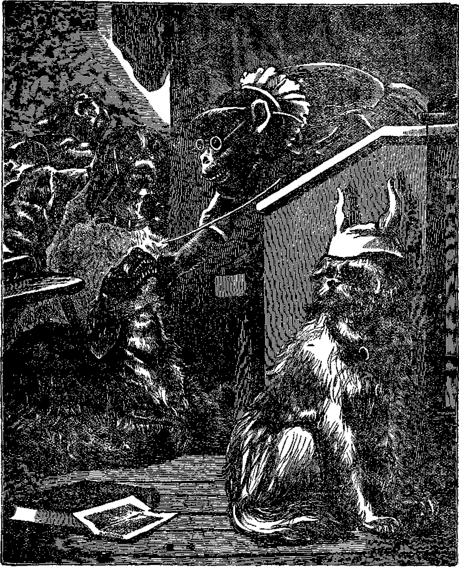
Ἡ Μαίμου καὶ τὸ σκολοσχολεῖόν της.

Κυτεῖχτε τὴν στή Γεωγραφίαν... Στὴν ἄρ' ἀνεβασμένη, Τὰ ματ' ἀγνώστ' ἀφορᾷ, κ' εἰς τόσο θυρωμένη... Κανένα ἀπὸ τὰ σκολιά δὲν θέλει νὰ δευλίση.