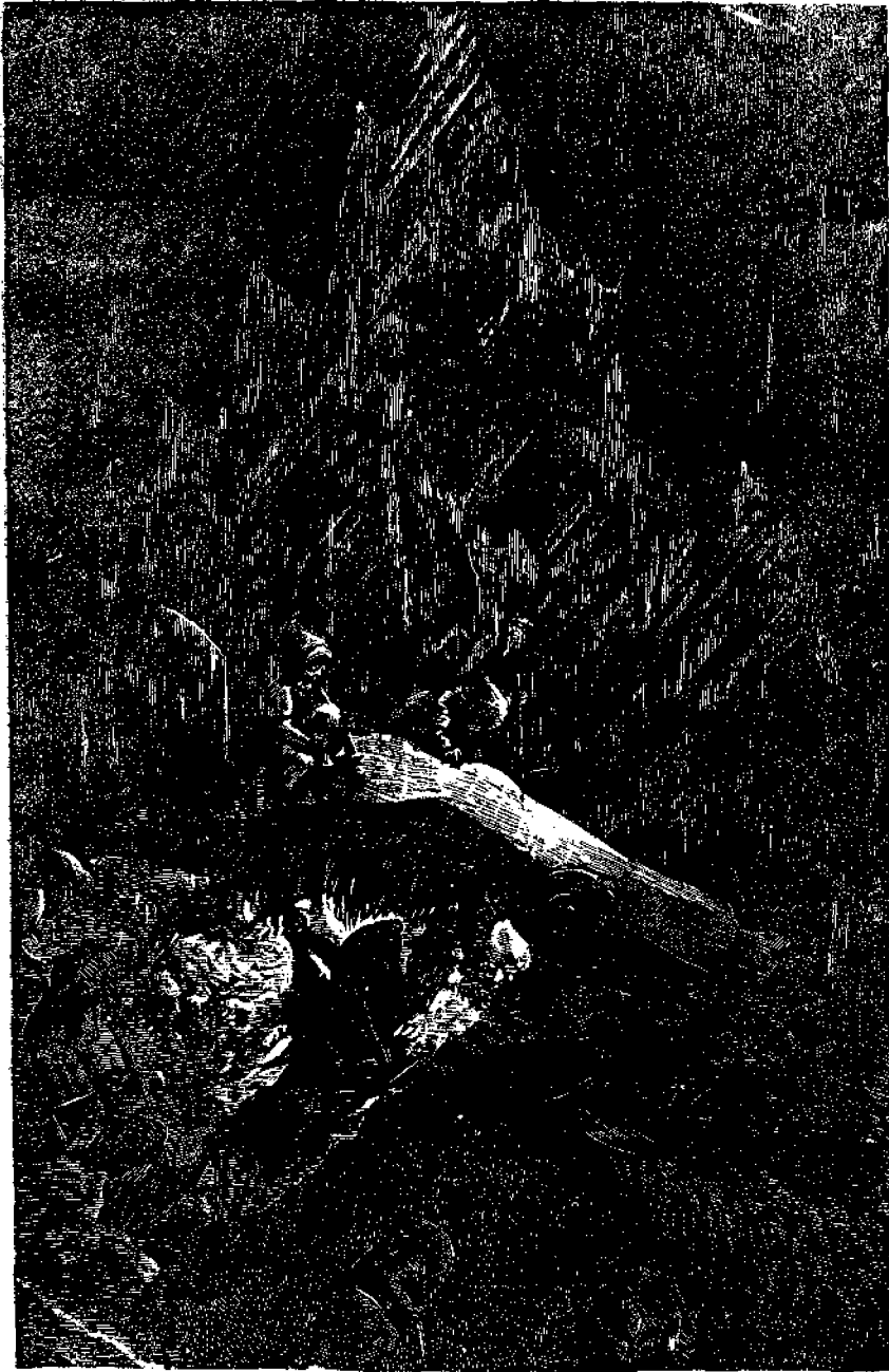
Ἰχθυόσαυροὶ εὐρέθεις ἐν Σιβηρίᾳ.

μὲ ἀνθρωπίνην κεφαλὴν, ὡσαὶ διὰ τῶν ὀφθαλμῶν ἠδύνατο νὰ διακρίνη μακρόθεν τὴν λείαν του, εἰς τὴν ἐποχὴν ἐκείνην, κατὰ τὴν ὑπόψιν ἢ ἐπιφάνεια τῆς γῆς ἔτι κε-