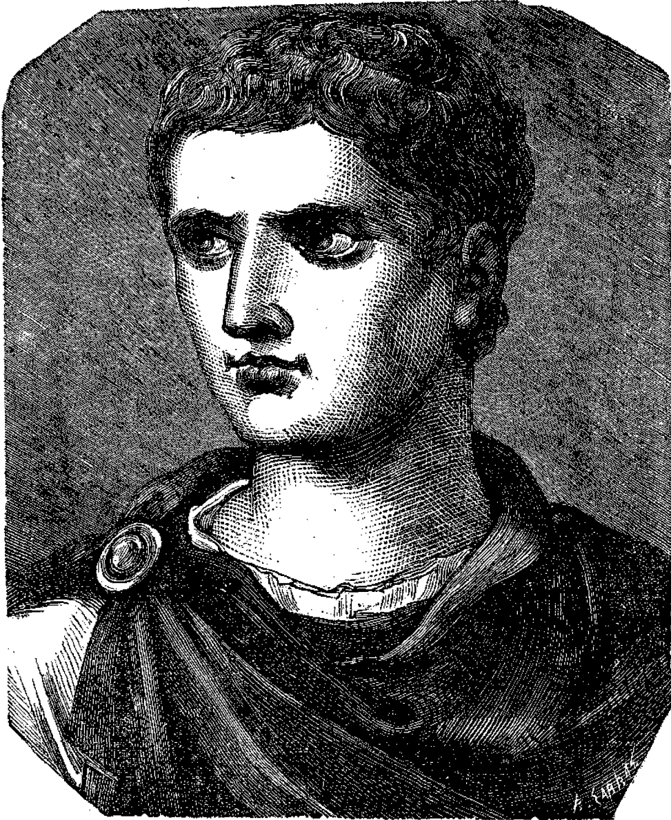
Αὐγούστος Καίσαρ πρῶτος αὐτοκράτωρ τῆς Ῥώμης.

ἂν καὶ τετραετίας ἀπέλασε τὸν πατέρα του, ἐξέκοι- δέθη δὲ μετὰ μεγάλης ἐπιμελείας ὑπὸ τοῦ θεοῦ τοῦ Ἰουλίου. Ἐνῶ δὲ εὐρίσκειτο εἰς τὴν Ἀπολλωνίαν τῆς Ἰλλυρίας ἐπληροφορήθη περὶ τοῦ θανάτου τοῦ Ἰουλίου Καίσαρος, καὶ μολοῦντι δεκαοκταετίας τὴν ἡλικίαν ἔ-