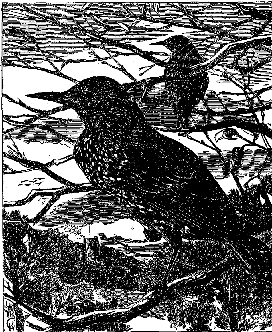
Φαρύγια ἢ μαυροπόδιον.

Ἐν ἀπὸ τὰ περίεργα φαινόμενα, τὰ ἡποῖα παρουσιάζουν τὰ φαρύγια κατὰ τὴν πτήσιν των, εἶναι καὶ τοῦτοι