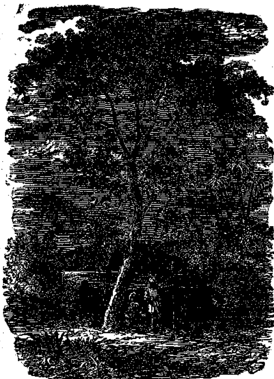
Κέτρον τὸ Παρδεισάκιον.

Είς ούδένα, πλὴν τῶν τακτικῶν ἀναποκριτῶν, στέλλεται ἡ Έφημερίς τῶν Παίδων ἀνευ προπληρωμῆς.