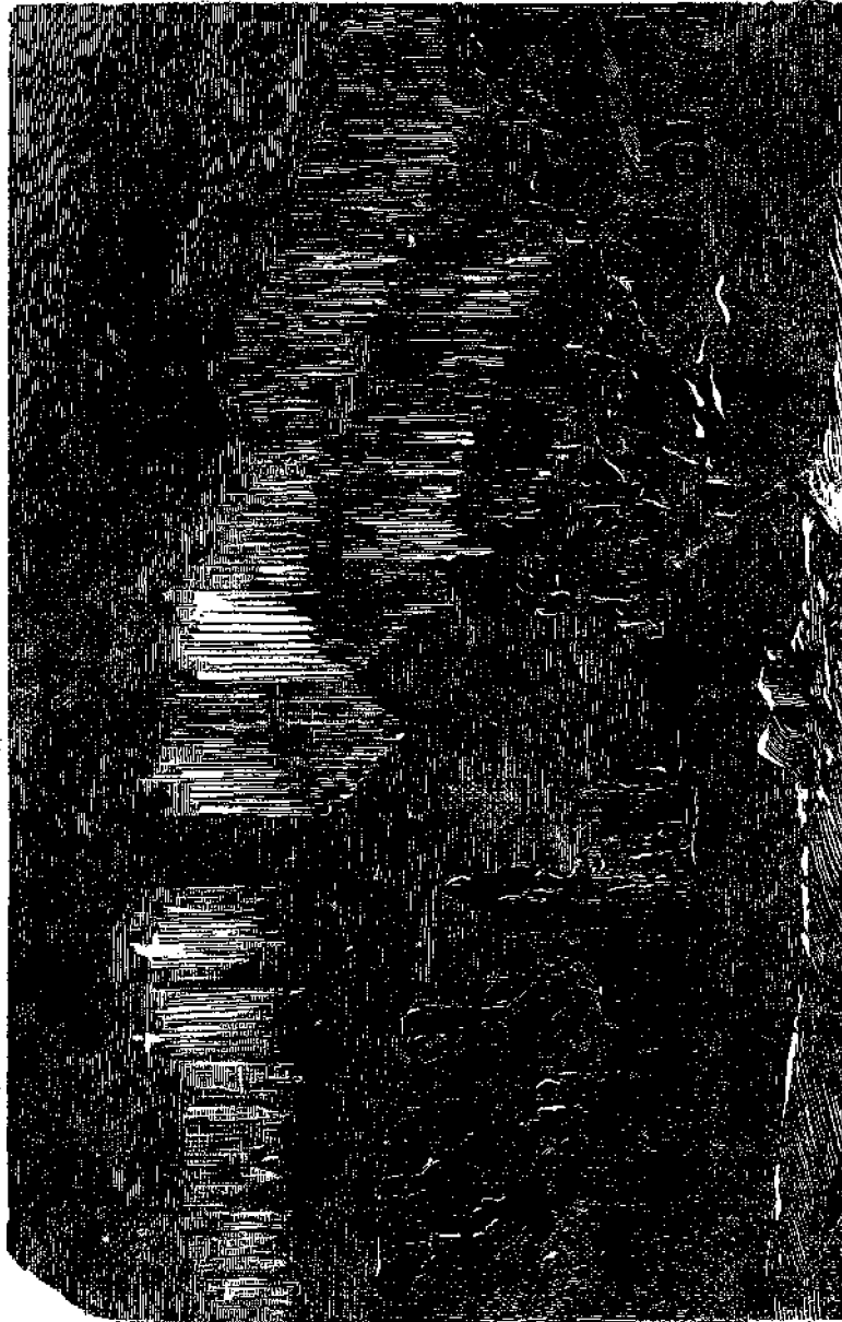
Τὸ Βόρειον Σέλας.

Ὅτως ὁ οὐράνιος ἡμῶν Πατὴρ παρέχει εἰς ἡμᾶς διὰ τοῦ φαινομένου τούτου νέαν ἐνδειξιν τῆς πανσοφίας καὶ ἀγαθότητός του, ἣ δὲ θεωρία τῶν φυσικῶν φαινο-