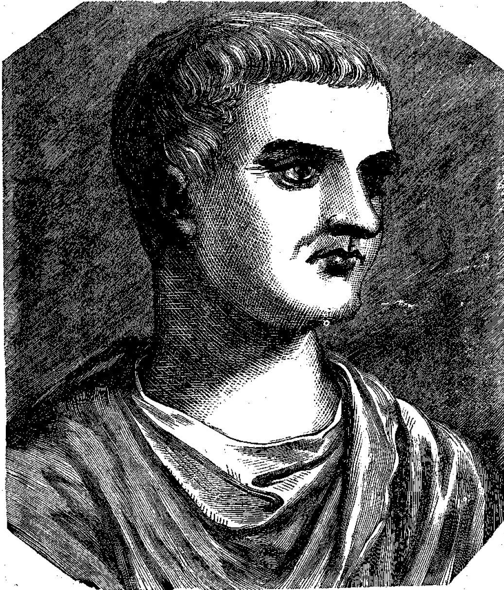
Τιβέριος 2ος αὐτοκράτωρ τῆς Ῥώμης.

τὰ σπέρματα πολλῶν ἐλαττωμάτων, τὰ ὅποια ἀνεπτόχθησαν εὐθὺς ἀφοῦ ἀνῆλθεν εἰς τὴν ὑπερτάτην ἀρχὴν, ἐπιθεβαιῶν οὕτω τὸ ἀξίωμα, « Ἀρχὴ ἄνδρα δεικνύουσι » διότι μετὰ τῶν ἄλλων, οἵτινες ἐφρονεῦθησαν κατὰ διαταγὴν τοῦ, ἦτο καὶ αὐτὴ ἡ μήτηρ τοῦ, εἰς τὴν ὅποιαν ἐχρεώσται τὸ διάδημα.