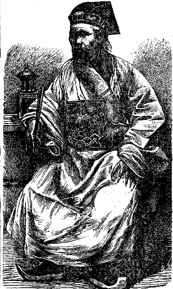
Μανδαρῖνος ἐν στολῇ.

Ὅπως πᾶς ἄλλος ὑπάλληλος, οὕτω καὶ οἱ Μανδαρῖνοι ἐκλέγονται διὰ συναγωνισμοῦ ἐκ τῶν διελθόντων δι' αὐτῶν ἐξετάσεων· διακρίνονται δὲ αἱ διαφοροὶ αὐταὶ τάξεις ἐκ τοῦ χρώματος τῶν κομβίων ἢ