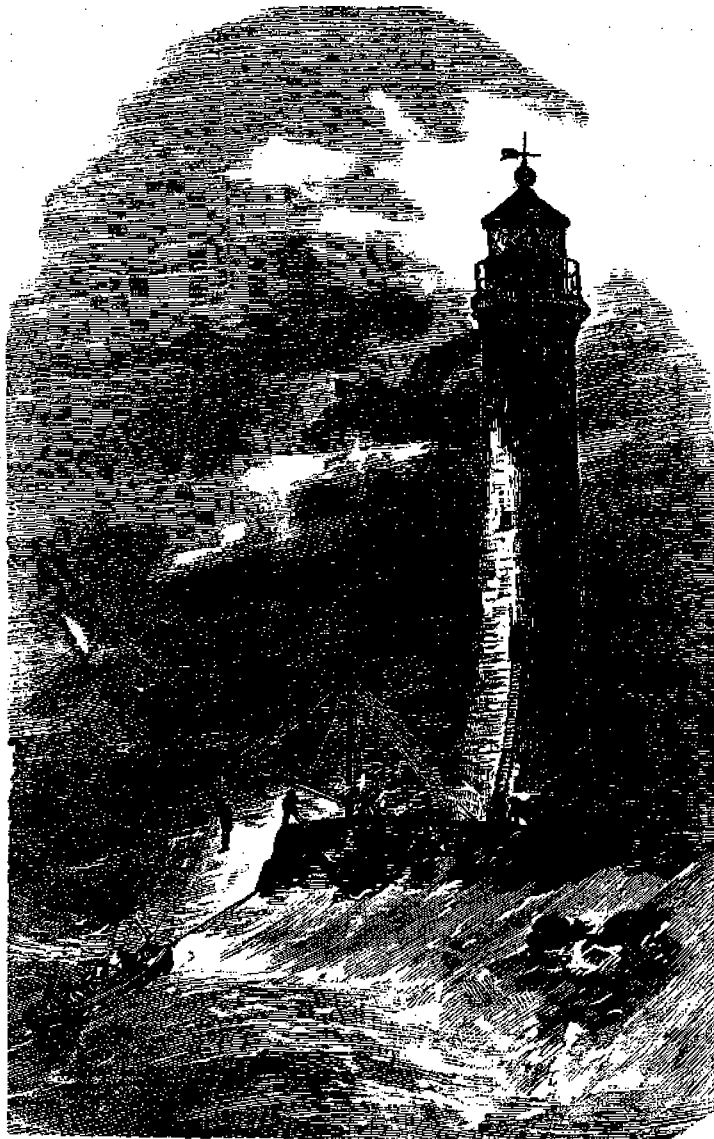
«Ο φάρος τοῦ Λυκοβράχου.

Ἐχει δὲ τέσσαρας φύλακας, τρεῖς τῶν ὁποίων κατοικοῦσιν ἐντὸς τοῦ πύργου, ἐνθ' ὁ τέταρτος μένει εἰς τὴν ἐξῆρᾰν μὲ τὴν οἰκογένειάν του. Ἐκαστος φύλαξ χρεωστῆ νὰ μείνῃ ἐντὸς τῆ πύργου εἰνα ὀλόκληρον μῆ-