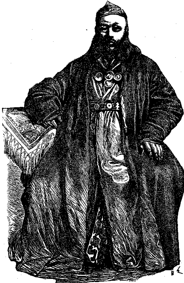
Ὁ Σουλτάνος τῶν Κιργγίζων.

Οἱ Κιργγίζοι διατηροῦσι πολλὰς ἐκ τῶν προτάριων τῶν εἰδωλολατρικῶν δοξασιῶν, ἀν καὶ γενικῶς θεωροῦνται ὡς Μωαμεθανοί· ὀλίγοι δ' ἐξ αὐτῶν ἀνήκουσιν εἰς τὴν