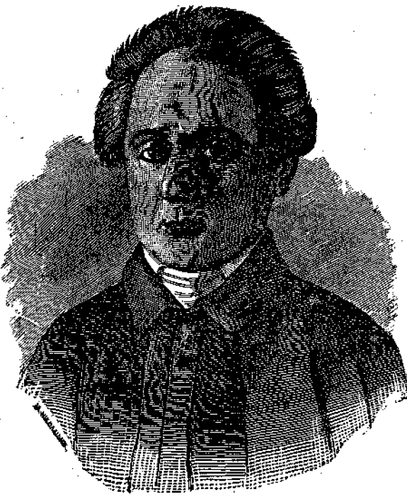
Ο Ζακύνθιος Ποιητής Σολωμός.

την στρατιωτικήν μουσικήν, άκούεται δέ φαλλόμενος και έν ταις οικίαις και έν τούς θεάτροις· ώστε κατήχησεν ήδη νά θεωρηται εις τών έθνικών ύμνων, καταταχθείς μεταξυ τών ύμνων του Ρήγα και άλλων.