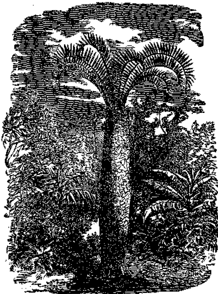
Ἀρτόκαρπος ἢ Καφφεριά.

Ἡ προειμένη εἰκὼν παριστᾷ δένδρον, ἀνήκον εἰς τὴν πλουσιάν, ὑλαίαν καὶ χρησιμωτάτην οἰκογένειαν τῶν φοινικοειδῶν· εἶναι δὲ αὐτοφύεον εἰς τὴν Καφφεριαν γῆν, κατὰ τὴν Νότιον Ἀφρικὴν, καὶ χρησιμεύει