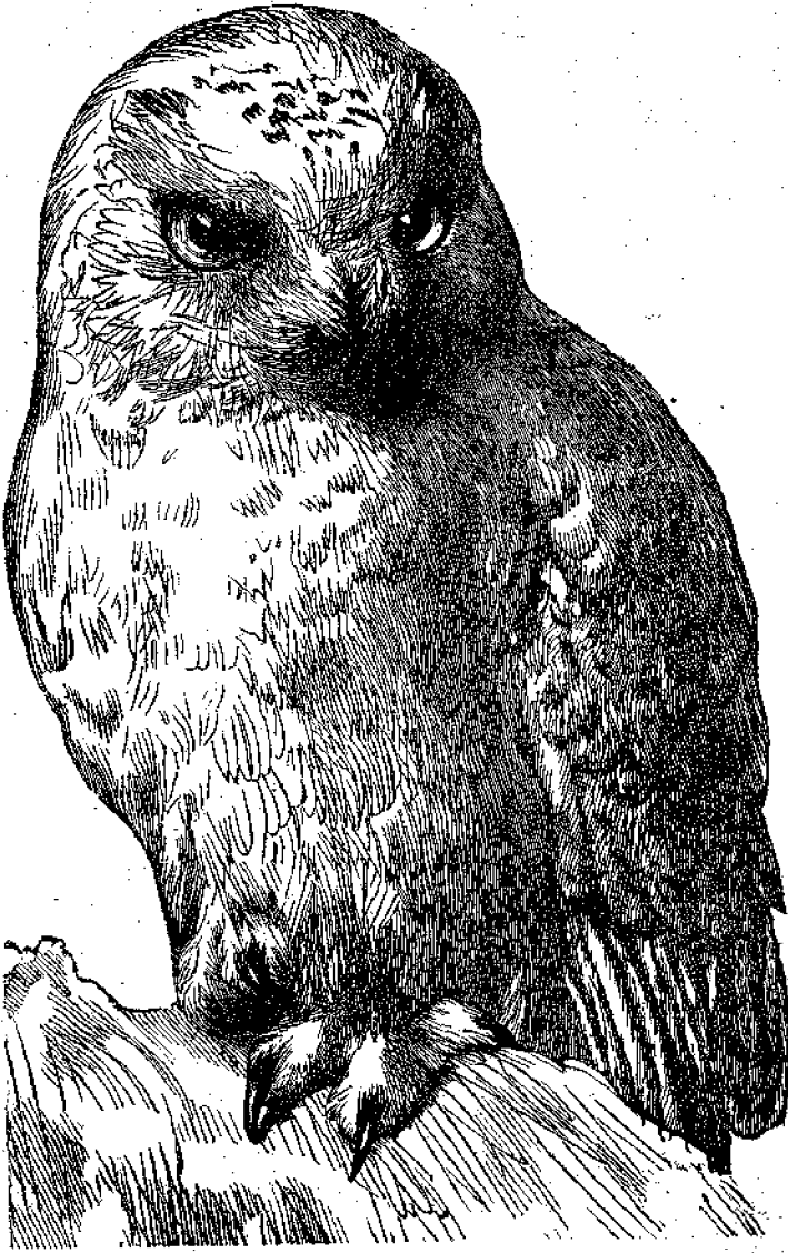
Κουκουβάγια ἢ κοινωφελής.

μικρότερα εἶναι πολὺ χρήσιμα εἰς τὸν ἄνθρωπον, διότι καταστρέφουσι μέγαν ἀριθμὸν σαυρῶν, πτηνῶν καὶ ἄλλων ἐπιβλαβῶν ζώων, καὶ διὰ τοῦτο δὲν πρέπει νὰ φονεῶνται· μίαν μόνην Γλαυὴν ὀποιοῦνται, ὅτι καταβροχθίζει κατ' ἔτος ἐκτὸς ἄλλων ὡς πρὸς τοὺς 300 ποντακοῦς!