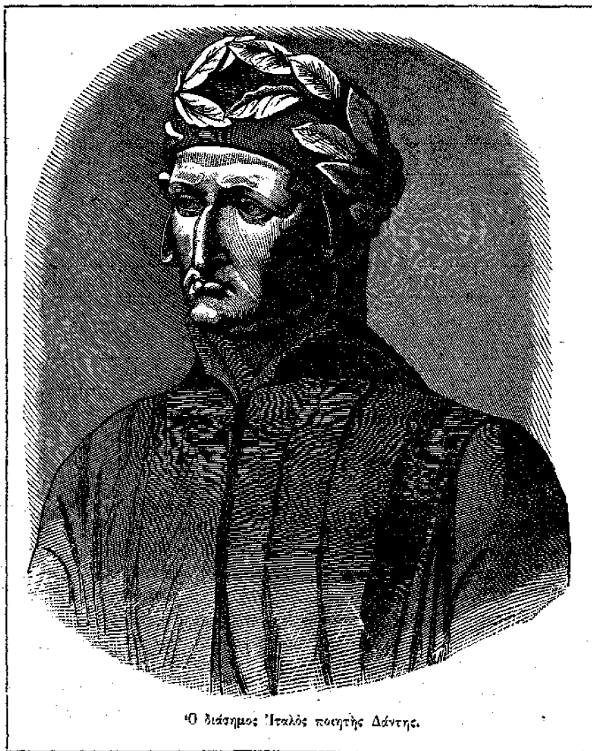
Ὁ διάσημος Ἰταλὸς ποιητὴς Δάντης.

τῆς Πέτρας, τῆς πρωτεύουσος τῆς Ἀραβίας· ἀλλὰ καθ' ὁδὸν μαθὼν τὸν θάνατον τοῦ αυτοκράτορος Τιβερίου, παρητήθη τῆς ἐκστρατείας καὶ ἐπέστρεψεν εἰς Συρίαν. Ἡ προκειμένη εἰκὼν παριστᾷ τὸν ἐν λόγῳ Ἀρέταν, ἐλήφθη δὲ ἐκ τινος νομίσματος, ὅπερ φέρει τὴν εἰκόνα αὐτοῦ, καὶ ἐμεγεθύνθη, δημοσιευθεῖσα τὸ πρῶτον εἰς τὸ ὠραῖον ἀγγλικὸν περιοδικὸν διὰ παιδίᾳ Prize, ἐξ οὗ καὶ ἡμεῖς τὸ ἐλάβομεν.