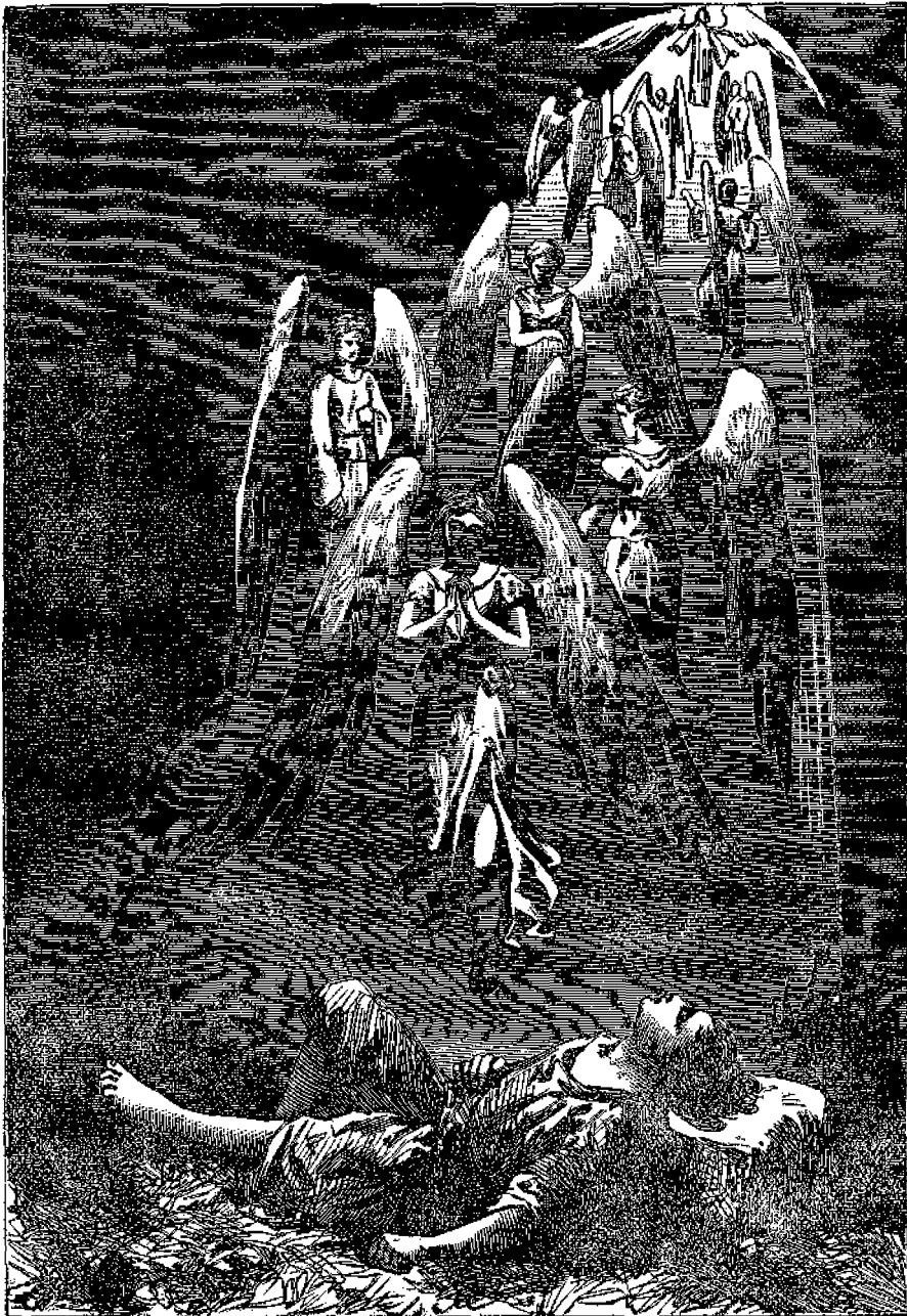
Α'. Ὀνειρον τοῦ Ἰακώβ.

βρομαρίου 1554. Καὶ ἡ μὲν Ἰωάννα, ὡς καταγομένη ἐκ βασιλικοῦ αἵματος, ἀπεκεφαλίσθη κατ' ἴδιον ἐντὸς τοῦ περιγῆμου κόρυθου τοῦ Λονδίνου, ὃ δὲ σύζυγός τῆς δημοσίᾳ ἐπὶ τινας λόφου. Ἡ Ἰωάννα ὑπέστη τὸν θάνατον μετὰ γαλήνης ἀβίας τῆς ἀθωότητος καὶ εὐσεβείας τῆς, μὴ συγκαταθεῖσα νὰ ἀποχαι-