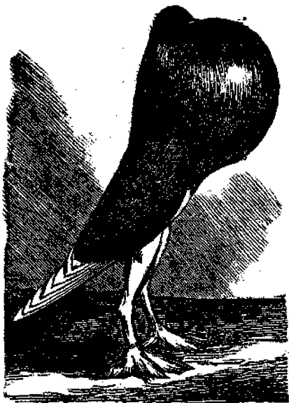
Παράδοξο: παραλληλή περιστέρων. (Ιδι προηγούμενον φύλλον.)

λιμνωθείσα ήτο ώρασιότατη, διενεήθη κακά περί αυ- της, και απεφάσισε να την νομφεουθή· αλλά τίς εδού- νατο να δώση αυτώ τριαύτην αδειαν; Είς μάτην πα- ρεκάλεσε και καθίδας, και μουφτίδας, και Χριστιανούς Ιερείς, και Έβραίους Χαχαμίδας, ουδεις συγκατατέθη. Έπί τέλους επέτυχε καθήν ασυναίσθητον, οστις λαβών χρήματα συνήνεσεν εις τον παράνομον γάμον. Άλλ'· οτε έφθασεν ή ήμέρα της τελετής, και συνήχθησαν οί κεκλημένοι, και ανήφθησαν οί κλιθανοί χάριν του γεύματος, ιδού μαυρίζει ο ουρανός, και αστραπτει, κθί βροντά, και κεραυνοβολεί και μεταβάλλει τον μόν γαμβρόν και την νύμφην και τον καθήν και τους κε- κλημένους και αυτους τους μαγείρους και παραμαγεί- ρους εις πέτρας, τους δέ κλιθάνους εις λουτρά θερμά!