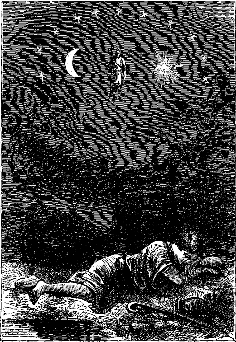
Η'. Τὸ ὄνειρον τοῦ Ἰωσήφ, (Γεν. λζ').

Ἀμφότερα τὰ ὄνειρα ταῦτα ἐπληρώθησαν, ὅταν ἡ θεία Πρόνοια ἀνέδειξεν αὐτὸν ἀκτιβασιλέα τῆς Αἴγυπτου, οἱ δὲ ἀδελφοί του, καὶ αὐτὸς ὁ πατήρ του, μετέβησαν εἰς τὴν Αἴγυπτον, καὶ τὰ προσεκύνησαν.