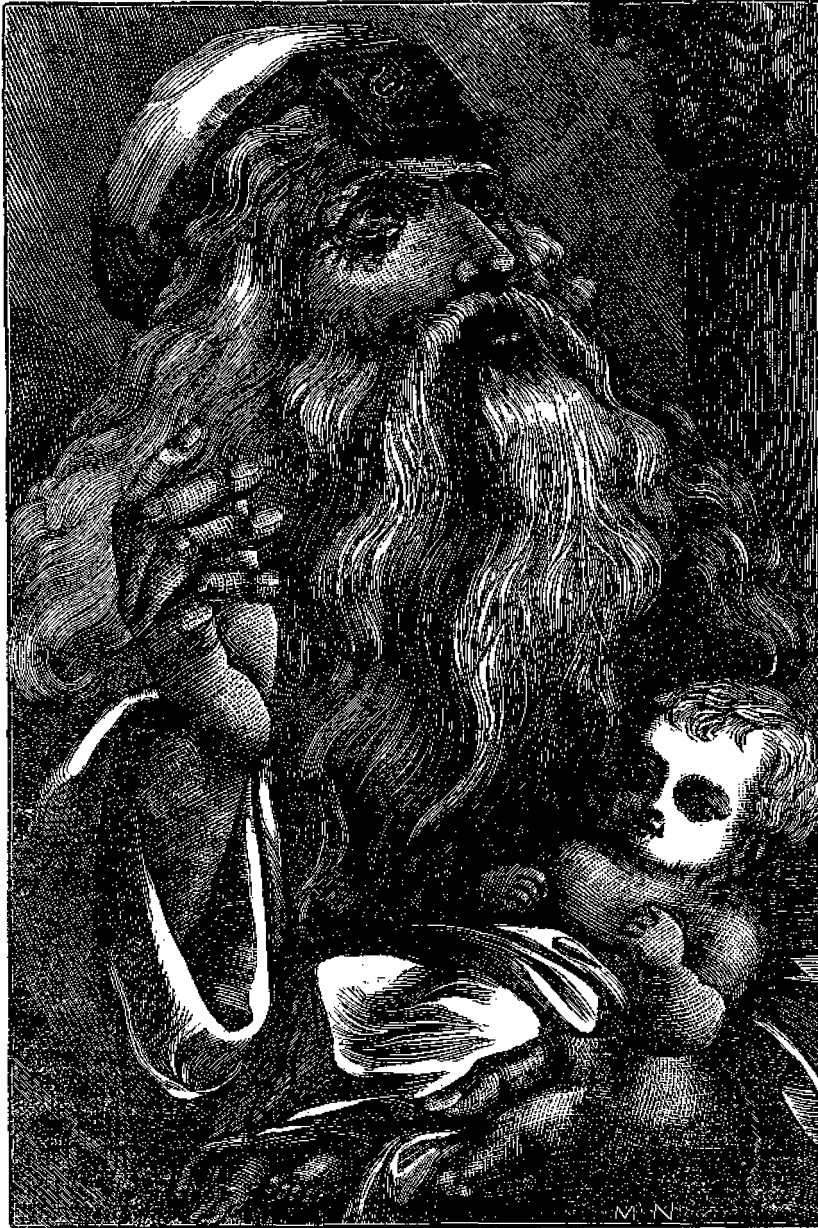
Ὁ Συμεὼν δεχόμενος τὸ παιδίον Ἰησοῦν εἰς τὰς ἀγκάλας του.

Κατὰ τὸν Μωσαϊκὸν νόμον μετὰ τὴν τεσσαρακοστὴν ἡμέραν ἀπὸ τῆς γεννήσεως βρέφους ἀρσενικοῦ ἢ θη-