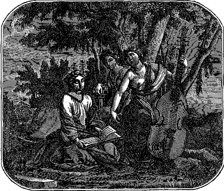
Αἱ τρεῖς Μοῦσαι.

Αἱ Μοῦσαι ἦσαν κατ' ἀρχάς ἐπιπνευστικαὶ πηγαῖαι νύμφαι, εἰς τὰς ὁποίας ἦσαν ἀφιερωμέναι πηγαῖαι, ἄντρα καὶ δάση (ἄλση). Ἀνέκαθεν ἐλάτρευον αὐτὰς ἡ φυλὴ τῶν Θρακῶν, οἵτινες ἐκ τῶν χωρῶν τοῦ Ὀλύμπου καὶ τῆς Πιερίας κατέβηον εἰς τὸν Ἐλικῶνα τῆς Βοιωτίας, ὅπου αἱ πηγαὶ Ἀγανίπη καὶ Ἰπποκρήνη ἦσαν ἱεραὶ τῶν Μουσῶν. Ἐκ τοῦ Ἐλικῶνος ἐξηπλώθη ἡ λατρεία αὐτῶν καὶ εἰς ἄλλους τόπους καὶ βαθμηδὸν καθ' ἅπασαν τὴν Ἑλλάδα. Διέμενον ὁμοῦ ἀσμένως εἰς τὰ παρὰ τὸν Ἐλικῶνα καίμενα δρυὲς Ἀεὶδῆθρον καὶ