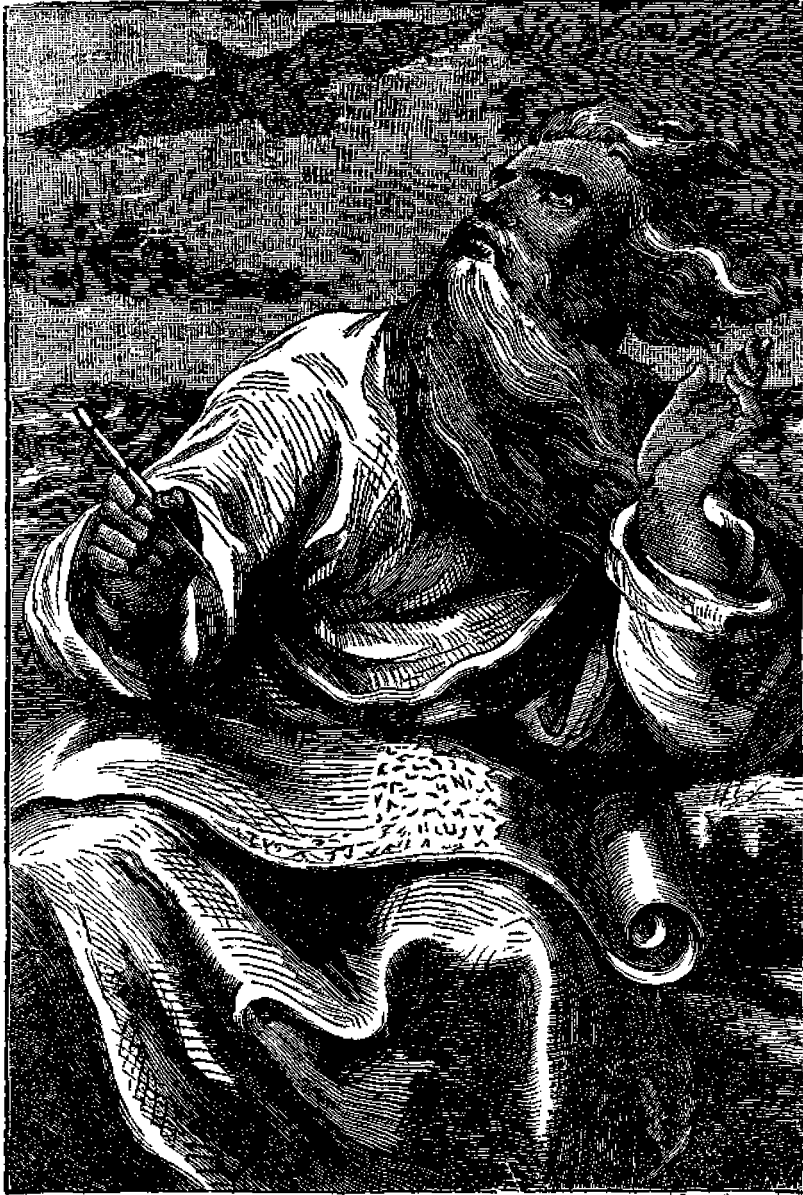
Ἰωάννης ὁ Εὐαγγελιστὴς γράφει τὸ Εὐαγγέλιόν του.

Μετά την άναστασιν του Χριστού διέμεινεν εν Ιερουσα- λημ, περι δε το 85 ετος μ. Χ. εβρισκομεν αυτον εις 'Εφεσον, όπου εβραζετο κηρυττων το Ευαγγελιον, ενσκα του οποιου, ως ο θιος λεγει εις την 'Αποκαλυψιν του, εξουσιαθη υπο των 'Ρωματων εις την νησον Πατμον, όπου διέμεινεν Ικανά ετη. 'Απαλλαγει της εξουσιας εγκατεσταθη ως φαίνεται εξειγε προσετι κατά την ταπεινοφροσύνην, την πρῶτην και τον υψηλον βαθμον πνευματικότητος. Τοσοτον δε η του Χρι- στου αγαπη ητο ερριζωμένη εν τη καρδια του διστε εκατον- τούτης αν και μη δυνάμενος να περιπατη η νι χαμηλῃ εφέ- ρετο επί καθίσματος εις την εκκλησιαν, και επανελάμβανε την φράσιν, «Τεχνία, αγαπάτε ἀλλήλους.»