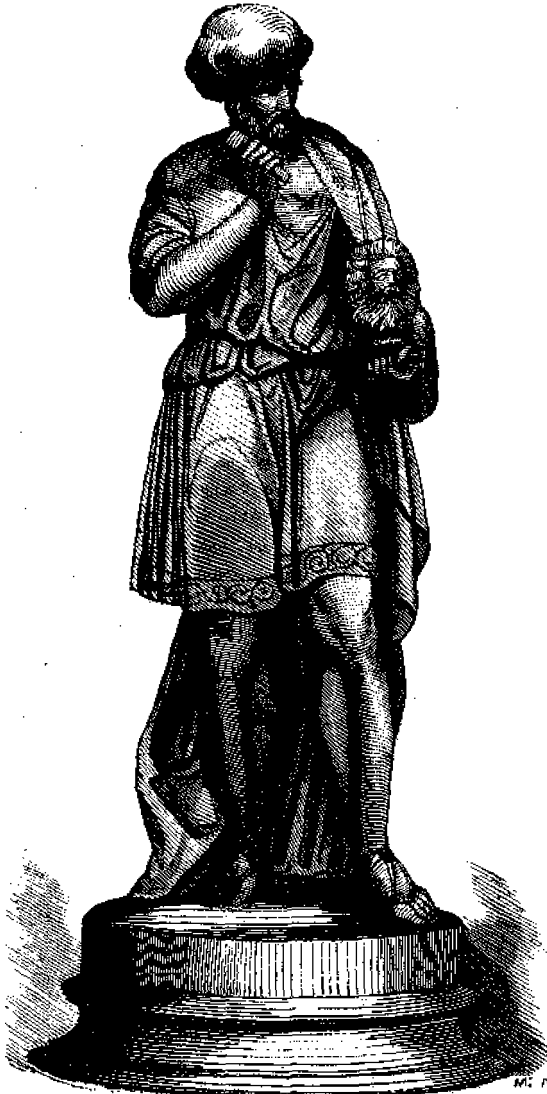
Φειδίας ὁ ἀγαματοποιός.

Περὶ τοῦ ἰδιωτικοῦ βίου του ἡ ἱστορία δὲν μας ἀναφέρει τίποτε. Ὅτι περὶ αὐτοῦ γνωρίζομεν συνδέεται μὲ τὴν ἀγα-