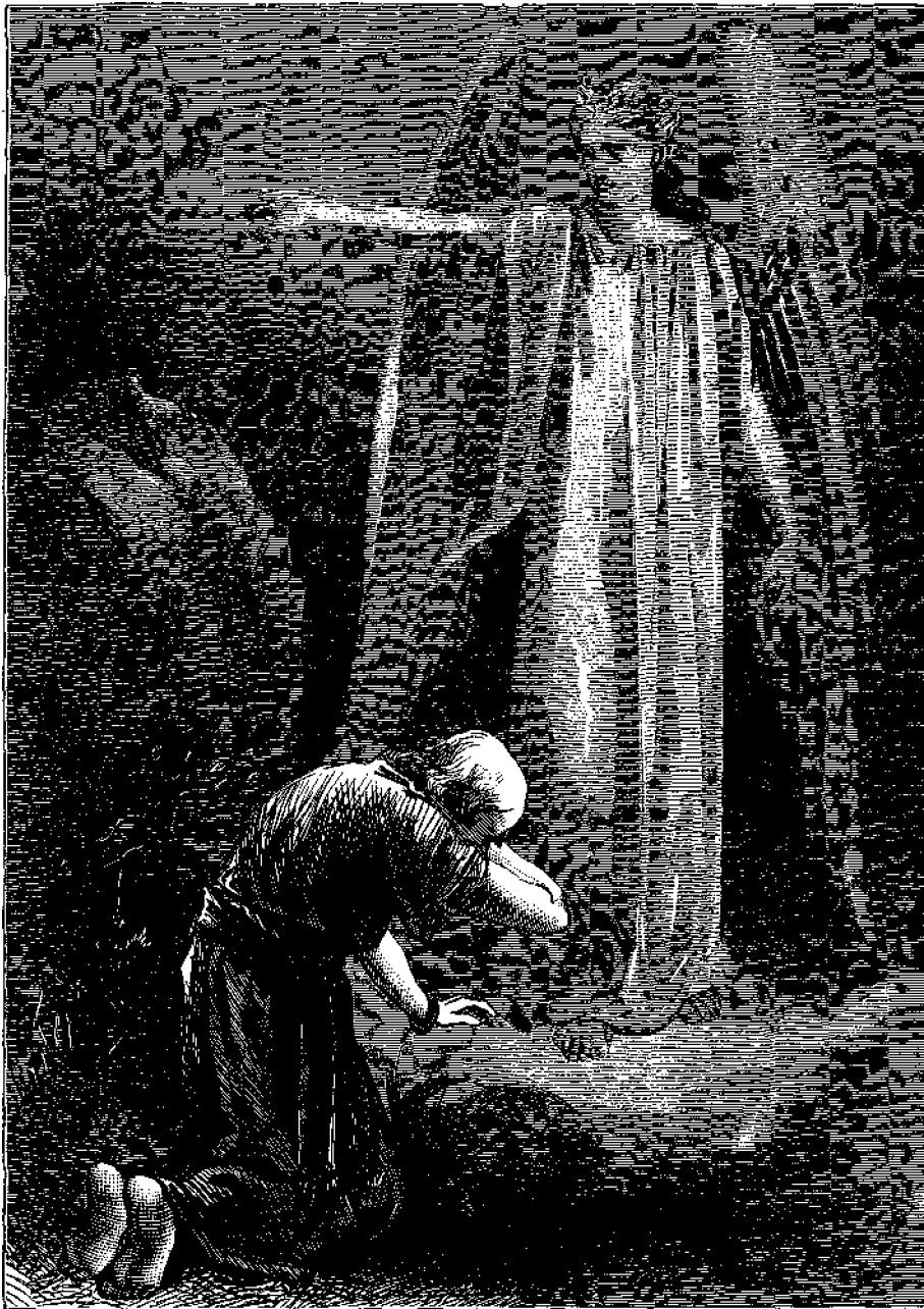
Ἰωάννης ὁ Εὐαγγελιστὴς ἐν ἐκστάσει.