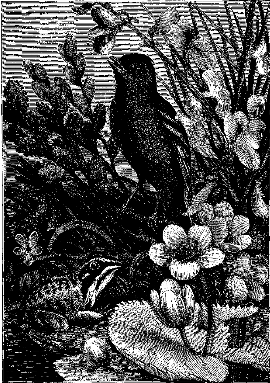
Ἡ ἀηδὼν ψάλλουσα μεταξὺ τῶν ἀνθέων.

τὸν δρόμον σύννεφον κονιορτοῦ, καὶ ἕσον προχωρεῖ πληθαίνει. Καὶ ἐκεῖ! δὲν εἶναι ἐν ἄλλογον;» Ἐν μίᾳ στιγμῇ συνήχθη ὅλη ἡ οἰκογένεια ἐκεῖ ὀλόγυρα.