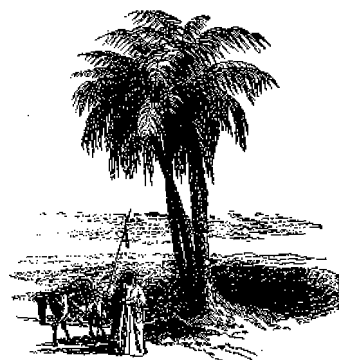
Φοῖνιξ ἐν τῇ Ἐρήμῳ.

Διηρεῖτο δὲ ὁ ἄδης εἰς τέσσαρα μέρη 1) τὸ μέρος, ὅπου ἦσαν τοποθετημένα τὰ δικαστήρια, 2) τὸ μέρος, ὅπου ἦτο τὸ καθαρτήριο, ἔνθα ἔκειον αἱ ψυχαὶ ἐπὶ τινὰ χρόνον 3) τὸν Τάρταρον, εἰς τὸν ὅποιον ἐστῆλλοντο οἱ καταδικαζόμενοι εἰς τὰ βάσανα· καὶ 4) τὰ Ἡλύσια πεδία, ἅτινα ἦσαν ἡ χώρα τῶν μακαρίων, ὅπου κατήκον αἱ ψυχαὶ τῶν ἀγαθῶν ἀνθρώπων καὶ εἶχε τὸ παλάτιόν του καὶ αὐτὸς ὁ Πλούτων μετὰ τῶν αὐλικῶν καὶ ἄλλων ἀξιωματικῶν αὐτοῦ. (Ἀκολουθεῖ.)