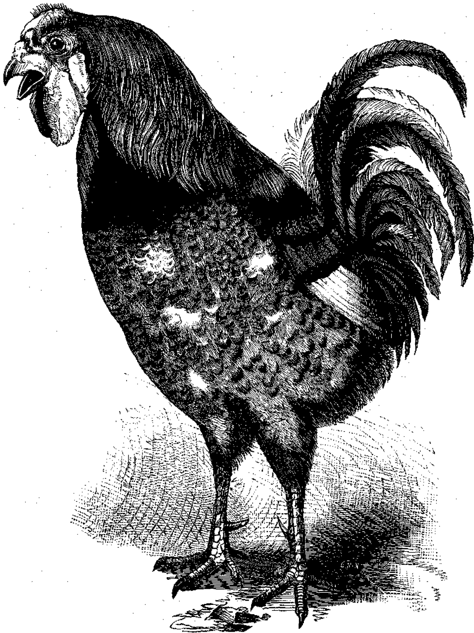
Ἄλέκτωρ τῆς Κίνας.

Ἐπειδὴ δὲ ἄλλοι γνωρίζετε τὴν ἱστορίαν του, καλὸν εἰσάγετε νὰ σᾶς εἰπῶ ἄλλα περὶ τούτου. Ὁ ἀλέκτωρ, ὅπως καὶ ἡ ὄρνιθα, ἦ τις καὶ ἀλεκτορικὸς κάποτε λέγεται, δὲν εἶναι αὐτόχθωνος τῆς Ἑβρώπης, ἀλλ' εἰ-