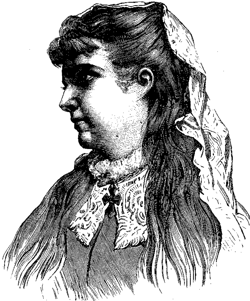
Ἡ διὰ τὴν ὠραιότητα τῆς βραβευθεῖσα Οὐγγαρις κόρη.

Εἰς τὰς ἡμέρας μας τρεῖς τοιοῦτοι ἀγῶνες ἔλαβον χώραν μέχρι τοῦδε, ὁ πρῶτος ἐν Ἀμερικῇ ὑπὸ τοῦ δια-