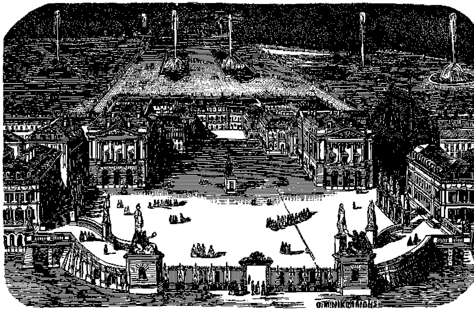
Τά άνάκτορα τών Βερσαλλιών.

Λουδοβίκος ο ΙΓ΄ πρώτος κατεσκεύασεν εκει φρούριον πυργωτόν, ο δέ διάδοχός του Λουδοβίκος ο ΙΔ΄