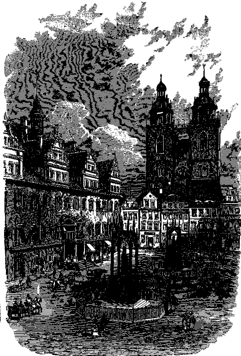
Ὁ ἐν Γουτεμβέργῃ ναὸς Σκλόε.

Ὁ κυριώτερος ναὸς τῆς πόλεως ταύτης εἶναι ὁ καλούμενος Σκλόε, ὑπεράνω τῶν θυρῶν τοῦ ὁποῦ οὗ ὁ Λουθήρος ἐπέμασε τὰ 25 αὐτοῦ ἐπιχειρήματα κατὰ τῆς Παπικῆς Ἐκκλησίας, προκαλῶν πάντα βουλόμενον νὰ συζητήσῃ μετ' αὐτοῦ ἐπὶ τούτων.