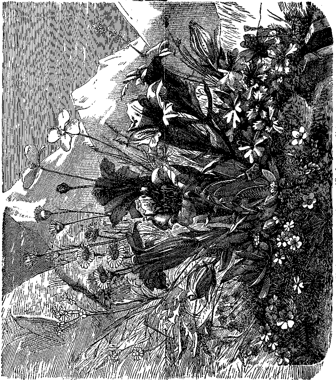
Ἄνθη φυόμενα εἰς τὰς Ἑλληδικὰς Ἄλπεις.

Εἰς τὴν Ἱατρικὴν μεταχειρίζονται τὴν ῥίζαν καὶ τὰ