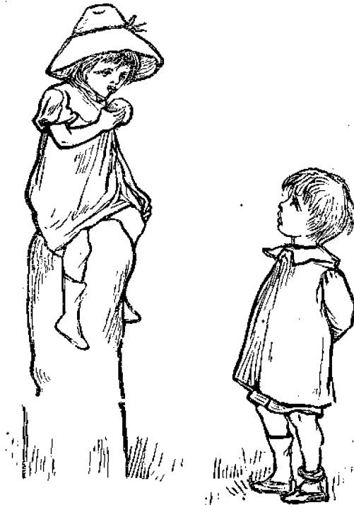
Ἡ ΦΙΛΑΥΤΙΑ ΤΗΣ ΜΙΚΡΑΣ ΕΛΕΝΗΣ.

ναι ἄλιγον ὀκνηρὸς καὶ προσποιεῖται ὅτι δὲν τον θέλετε διὰ σύντροφον.» (Ἀκολουθεῖ).