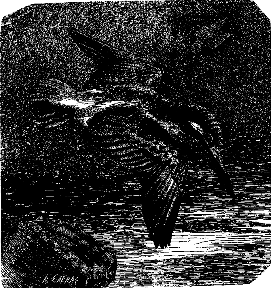
Ἡ Ἄλκυών περιπετώσα πρὸς ἀνδράσιν λεία.

Ἄλλ' ἐξαίφνης ὠραῖαν πτωίαν ἐνὶ ἔπλευ μόνος, τὸ κύμα ἐξηκούεται μ' ἀνέμου μανίαν καὶ τοῦ Κόηκος γίνεται μνήμα.