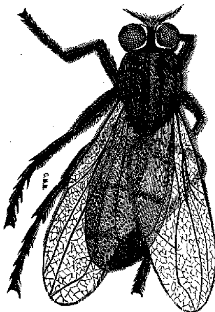
Ἡ μυῖα ὡσ φαίνεται ὑπὸ τοῦ μικροσκοπίου.

Ὁ λάρυξ προσέτι τῆς μυῖας εἶναι περιεργοσ ὡσ πρὸς τὴν κατασκευὴν, διότι φέρει κατὰ τὸ ἄνοιγμα αὐτοῦ πρὸς τὰ ἄνω εἶδοσ τι διῦλιστήροσ, (διεργιστήριον) ὅστικ ἐμποδίζει τὴν σκόλιν, τὴν ὅποιαν ἀναπνέει ἡ μυῖα, ἀπὸ τοῦ νὰ εἰσέλθῃ εἰς τὰ ἀναπνευστικά τῆς