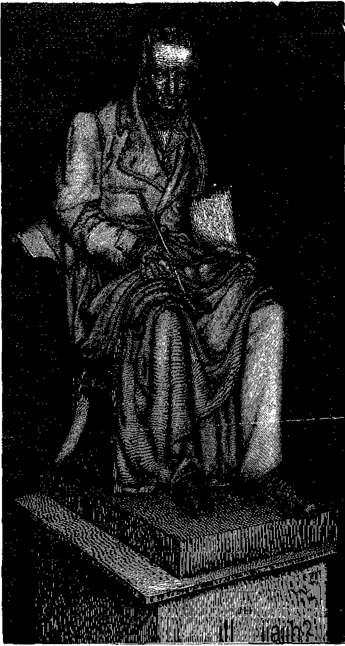
'Ο 'Αδαμάντιος Κοραΐς.

και ποδηγέτην αυτού εις την Εδωγγελικὴν άρετήν. Είς τά συγγράμματα και τάς προσπάθειάς του Κοραΐ ήφείλεται κομῶ ο ύπέρ της πίστις και πατρίδος ζήλος, όστις έρλεγε τάς καρδιας των άπανταχού της