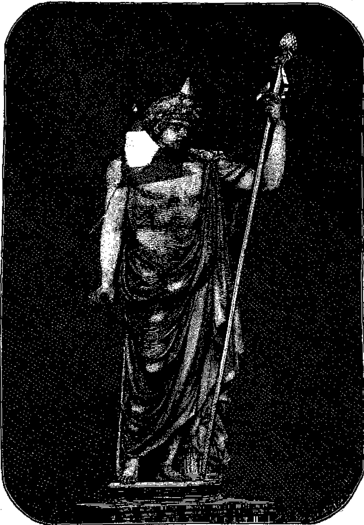
Ὁ Ὀμηρικὸς Ἀντίνοος.

χαιραν τοῦ Ὀδυσσεύς. Ὁ Ὀμηρὸς περιγράφει τὸ Ἀντίνοον τοῦτον, τὴν κατὰ τοῦ Ὀδυσσεύς ὀργὴν το καὶ τελευταίον τὸν θάνατόν του γραφικώτατα ἐν τῇ Ὀδυσσεΐα, βιβλ. ιη. καὶ κβ'. Ὅσοι δὲ τῶν μικρῶν ἀναγνώστων μας λάβουν τὴν εὐτυχίαν ν' ἀναγνώσουν τὸν Ὀμηρὸν, θέλουσι εἶδει πόσον ὠραῖα παριστᾶται ἐν τῷ προσώπῳ τοῦ Ἀντινοῦ τὸ ἀγέρωχον καὶ προκατὲς ἦθος καὶ ὀποῖον τὸ τέλος τοῦ ἀνθρώπου τοῦ ἔχοντος αὐτό.