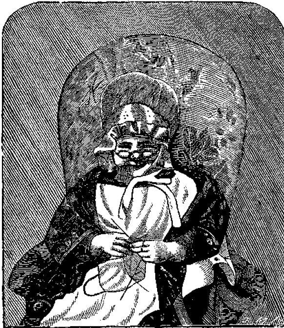
Ἡ μικρὰ κυρούλα

Ἵπὸ τὸ διαμέρισμα τῶν ἐπιβατῶν κεῖται τὸ τρίτον διαμέρισμα περιέχον συσκευὴν, κατασκευασθεῖσαν ἐπὶ τῇ βάσει τῶν φυσικῶν ἀρχῶν τῆς κολυμβητικῆς κώστεως τῶν ἰχθύων, ἥτις θέλει καθιστᾶ αὐτὸ βαρύτερον ἢ ἐλαφρότερον κατὰ βούλησιν, διευκολύνουσα οὕτω τὴν ἀνάβασιν ἢ κατάβασιν αὐτοῦ ἐν τῇ θαλάσσει.