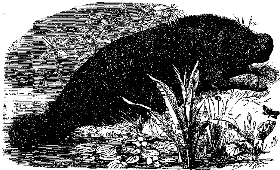
Μανάτη ἢ Αὐστραλιανή.

Τῆς Μανάτης ὑπάρχουν διάφορα εἶδη, δύο ἐκ τῶν