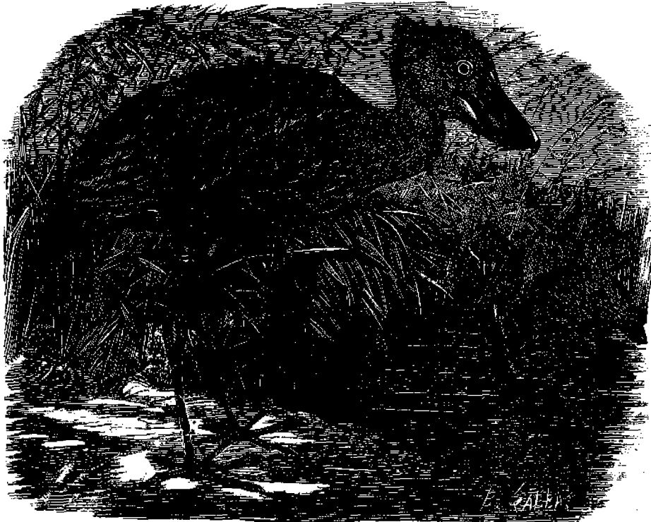
Ὁ φαλαινοκέφαλος Πελαργός.

Τὸ πτηνὸν τοῦτο ζῆ εἰς τὴν βόρειον Ἀφρικὴν πλησίον τοῦ ποταμοῦ Νείλου, σπανίως ὅμως ἀπαντᾷται