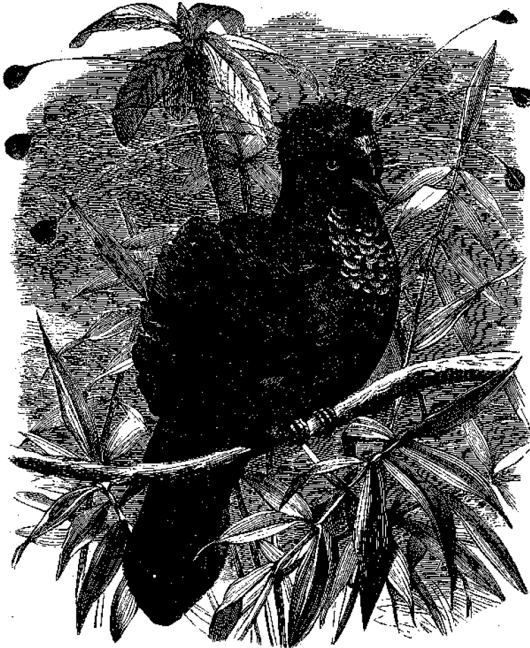
Χρυσοῦν πτηνὸν τοῦ Παραδείσου.

στολισμοῦς εἴτε πρὸς ἀναπλήρωσιν τοῦ φυσικοῦ κάλλους, εἴτε πρὸς βελτίωσιν αὐτοῦ, λησμονοῦσαι ὅτι πάντα ταῦτα εἶναι τὰ φύλλα, ἅτινα πρέπει νὰ ταῖς ἐνθυμίζωσι τὴν ἀπολεσθεῖσαν ὀρθότητα ἐν τῷ Παραδείσῳ τῆς Ἑδᾶμ, καὶ νὰ ὁδηγῶσιν αὐτάς εἰς ταπεινοφροσύνην.