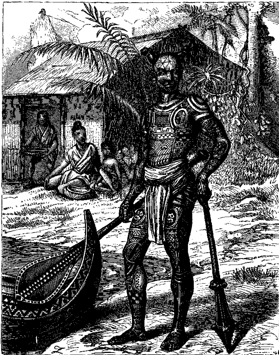
Πολεμιστὴς κάποιος τῶν Μαρκουεσσῶν νήσων.

Ὁ χρόνος, κατὰ τὸν ὁποῖον ἀνεκαλύφθησαν, δὲν εἶναι ἐξημερωμένος, τὸ δὲ 1842 καταλήφθησαν ὑπὸ τῶν