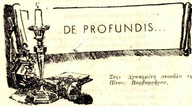
Στην Αγαπημένη ανοούλα της Πίτσα: Βαρθολόγγου.

Ήταν την ώρα που τα δυνατά χρώματα λιγόστεβαν. Όμορφο δειλινό ανοιξιάτικο. Δίπλα-μας η θάλασσα ξεκουραζόταν ηδονικά μ' ένα δροσάτο ανασασμό, και ο δρόμος άνοιγε καθάρος, ευωδιάτος. Περιπατούσαμε οι τρεις σιωπηλοί. Πόση ώρα;... Πολύ. Εκείνη λίκνιζε χαριτωμένα το σώμα της ακουμπώντας στα μπράτσα-μας, και μεις βυθισμένοι σε σκέψεις, χαιρόμαστε το άρωμα που ανάδιδαν τα μαλλιά-της. — Λοιπόν;... Ρώτησε και τα μάτια της βυθίστηκαν στις σκέψεις εκείνου, έσπασε τους κύκλους της γαλήνης, και γέλασε. Μας άρεσε τις ώρες που κουρασμένοι από τους τριπλούς τόνους της κουβέντας-μας και βυθισμένοι στην πρόσκαιρη σιγή, να σπάει το κρύσταλλο-της, με το μακρόσυρτο δόνημα τοῦ ντι... Λοιπόν;... Και γεμίσαμε χαρά στη φωνή-της.