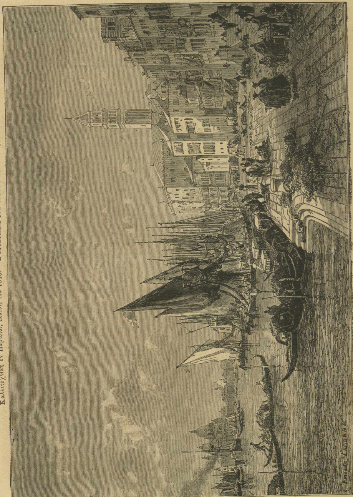
Καλλιτεχνικὴ ἐν Παρισίῳ ἔκθεσις τοῦ 1873.— Η ΠΡΟΚΤΜΑΙΑ ΤΩΝ ΣΑΛΥΩΝ EN BENETIA. Εἰκῶν τοῦ κ. Laborne.

χελοῦς βαδίσματος τοῦ ἐνετικοῦ λαοῦ, ὅστις σύρεται | ἄδων καὶ κατακλιόμενος εἰς ἕκαστον βῆμα ἐπὶ