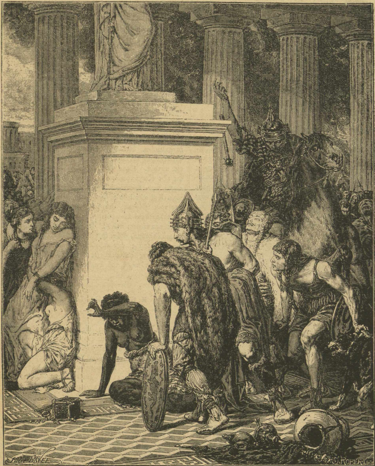
Η ΕΠΙΔΡΟΜΗ, εἰκῶν τοῦ κ. Lumainais.—Πολεμιστὰὶ Γαλάται μετ' ἐκπλήξεως βλέποντες μαύρην γυναῖκα.

Μεγίστη δὲ εἶνε ἡ εὐκολία μεθ' ἧς δύναται τις νὰ προμηθευθῇ τὰ τῆς ἡμέρας τρόφιμα, διὰ θαλάσσης βεβαίως πάντοτε. Κρεμᾶ ἕκ τινος σχοινοῦ καλάθιον καὶ