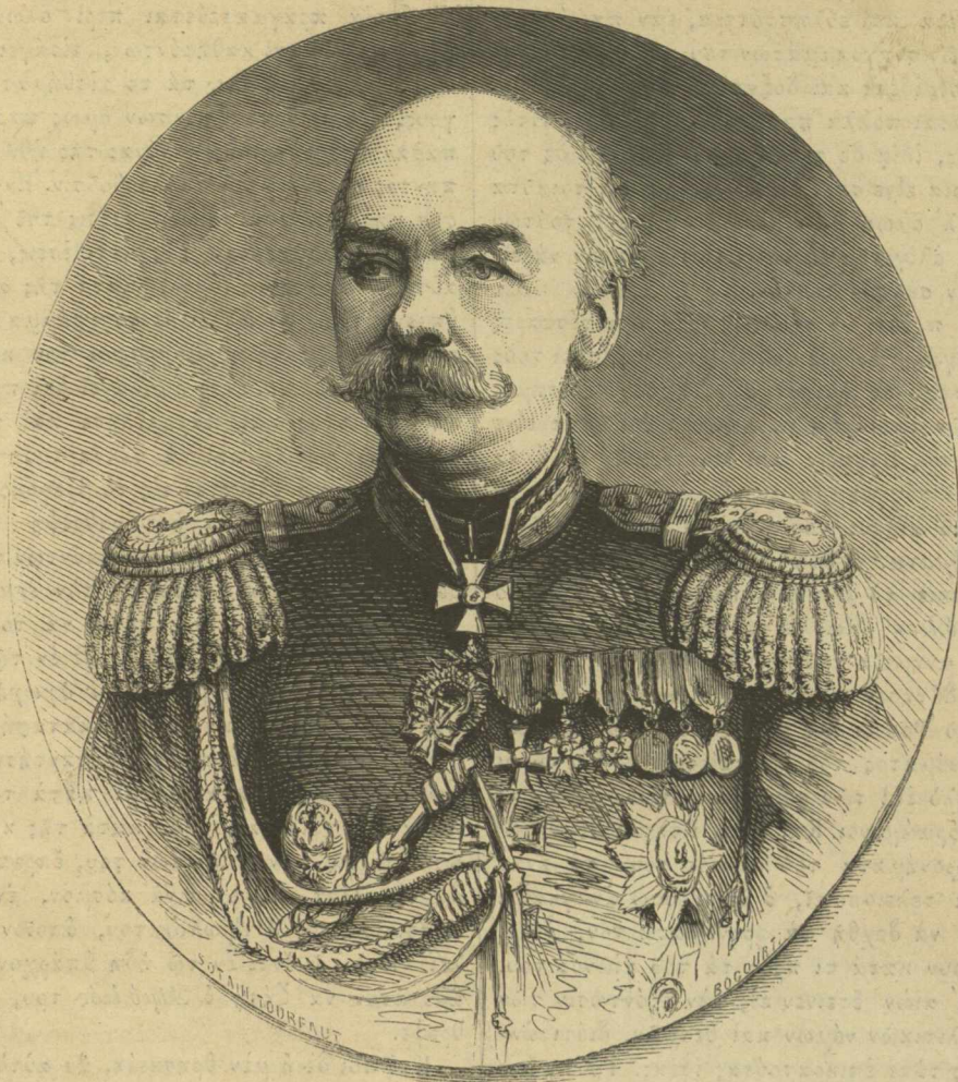
Στρατηγός ΚΑΟΥΦΜΑΝ ὁ πορθητὴς τῆς Χίβας.

Εἰπόντες ἐν σελ. 106 τοῦ Μουσείου ὀλίγα τινα περὶ Χίβας καὶ τῆς ὑπὸ τῶν Ῥώσων ἀλώσεως αὐτῆς, πρὸς συμπλήρωσιν ἐκείνων δίδομεν σήμερον τὴν εἰκόνα τοῦ κατὰ τὴν ἐκστρατεῖαν ἐκείνην ἀρχηγοῦ τῶν Ῥωσσιῶν στρατευμάτων στρατηγοῦ Κάουφμαν.