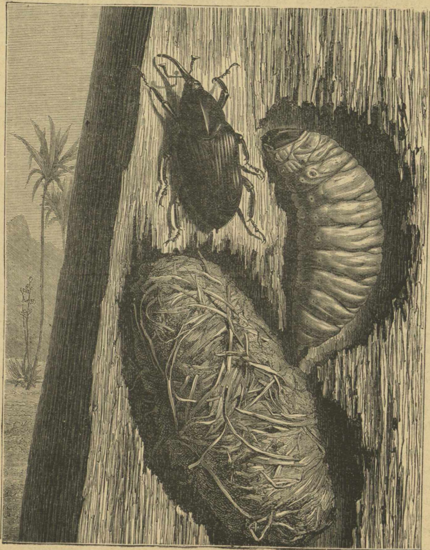
ΦΥΣΙΚΗ ΙΣΤΟΡΙΑ. — ΤΡΩΞ Ο ΦΟΙΝΙΚΟΚΟΛΑΠΤΗΣ καὶ μεταμορφώσεις αὐτοῦ.

ἔπειτα δὲ ἐπελθόντος τοῦ καιροῦ τῆς μεταμορφώσεως τῶν κατασκευάζουσιν εἶδος θήκης ἐκ λεπτοτάτων ἰνῶν τοῦ φοίνικος καὶ ἐγκλείονται. Μετὰ δεκαπέντε δ' ἡμέρας ἐξέρχονται ἐκ τῆς φυλακῆς τῶν ἐντομα τέλεια· δηλαδὴ κολεόπτερα μαῦρα ἔχοντα δυνατὴν προβοσκίδα καὶ ὄνυχας δξυτάτους, ὡς φαίνεται ἐν τῇ παρατιθεμένῃ εἰκόνι, ἥτις παριστᾷ κορμὸν φοί-