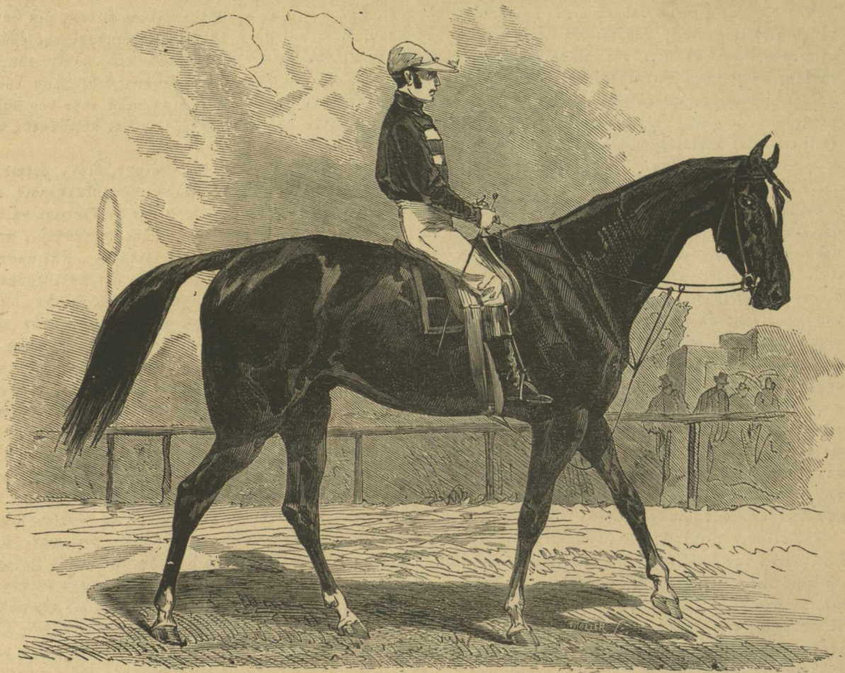
TRANT, ὁ ἵππος ὁ ἀριστεύσας ἐν τῷ μεγάλῳ ἵπποδρομικῷ ἀγῶνι τῶν Παρισίων τοῦ 1874.