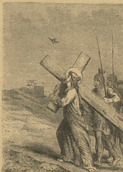
Ἐκ πάντων τῶν πτηνῶν μόνος ὁ Πετρίτης παρηκολούθησε τὸν Ἰησοῦν Χριστὸν εἰς Γολγοθᾶ.