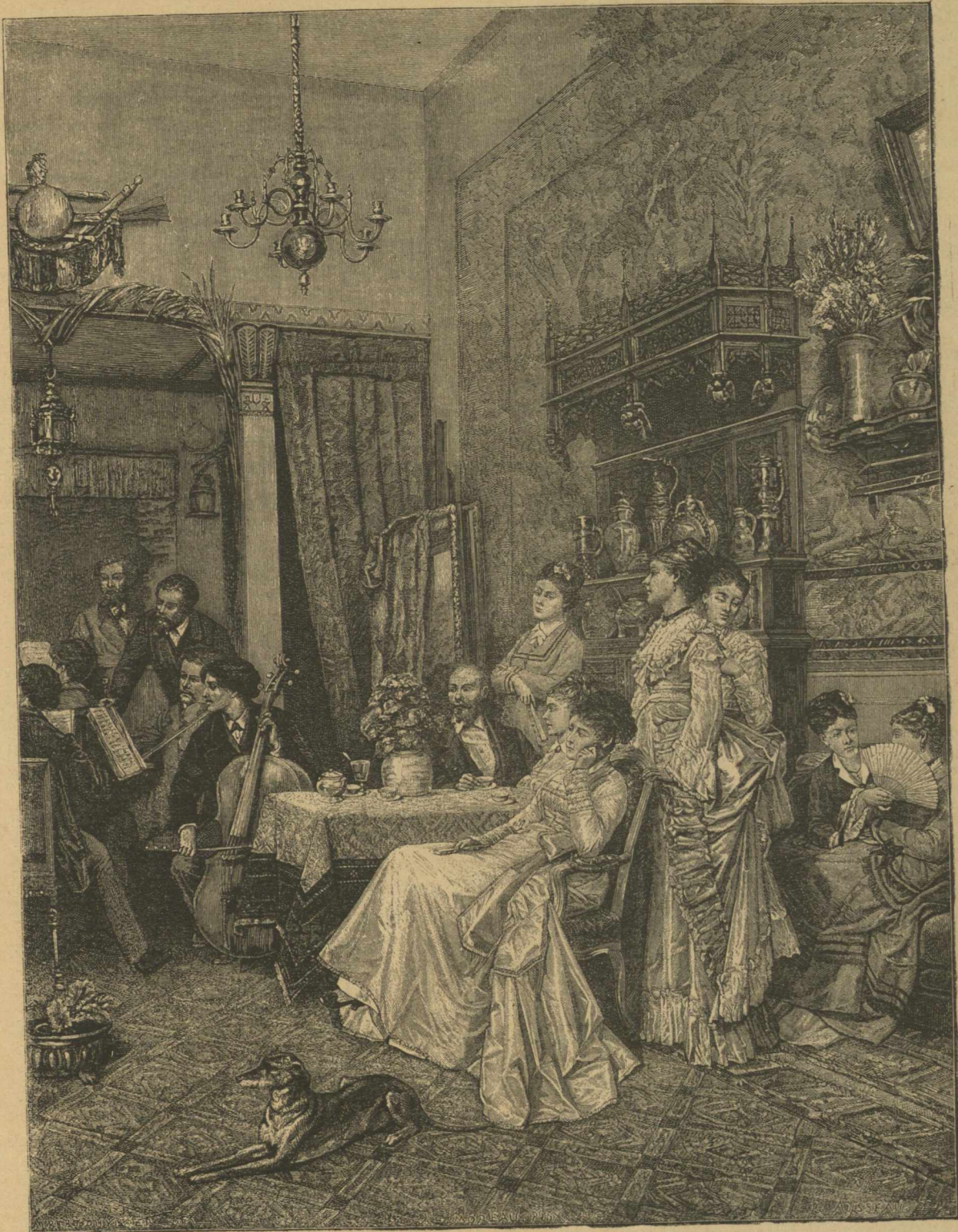
ΚΑΛΑΙΤΕΧΝΙΚΗ ΕΝ ΠΑΡΙΣΙΟΙΣ ΕΚΘΕΣΙΣ ΤΟΥ 1873

Συνουσία φιλομούσων ἐν ἐργατηρίῳ καλλιτέχνου. (Εἰκὼν Λουκιανοῦ Moreau).