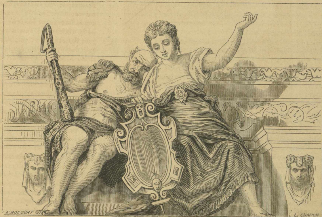
Τοιχογραφία ΠΑΥΛΟΥ ΒΕΡΩΝΑΙΟΥ ἐν Βίλλῃ Μαζέρα — ἸΣΧΥΣ καὶ ΑΛΗΘΕΙΑ.

Οἱ Βάρβαρο θέλοντες νὰ κτίσωσιν ἔπαυλιν, ἀνέθηκαν τὸ ἔργον εἰς τὸν διάσημον ἰταλὸν ἀρχιτέκτονα Ἀνδρέαν Πηλλάδιον. Οὗτος γεννηθεὶς τῷ 1518 ἀπέθανε τῷ 1580. Διεκρίνετο δὲ διὰ τὴν ἐπιδεξιότητα μεθ' ἧς κατώρθου, διὰ τροποποιήσεων ἐλαφρῶν καὶ εὐφυστάτων, νὰ ἐφαρμόζῃ τὴν ἀρχαίαν ἀρχιτεκτονικὴν εἰς τὰς νεωτέρας οἰκοδομὰς, καθιστῶν αὐτὰς συμφώνους πρὸς τὰς νεωτέρας χρείας καὶ τὰ ἤθη. Ἐκόσμησε δὲ τὴν Ῥώ-