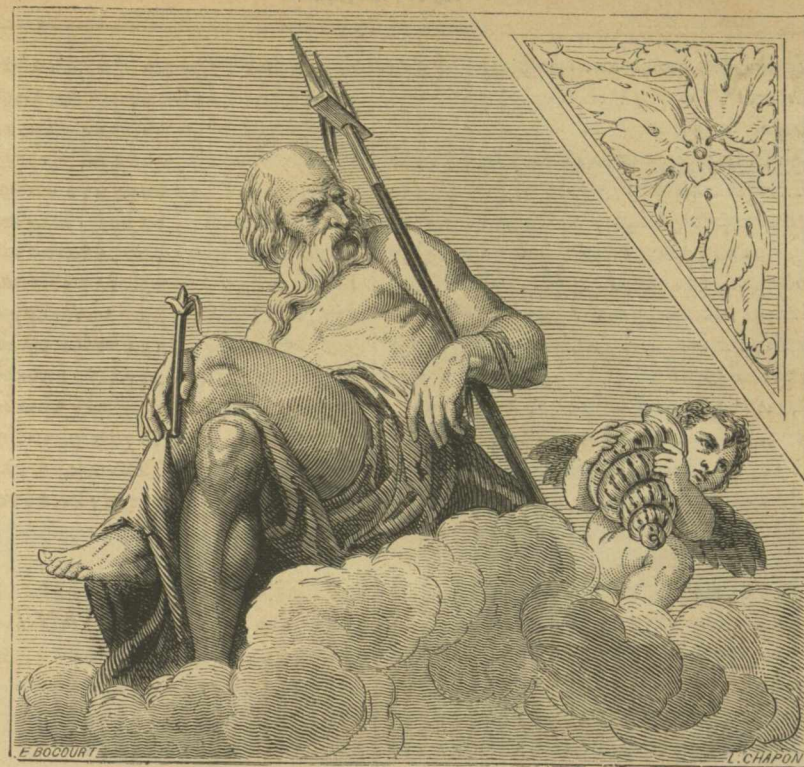
Τοιχογραφία τοῦ ΠΑΥΛΟΥ ΒΕΡΩΝΑΙΟΥ ἐν Βίλλῃ Μαζέρα — ΠΟΣΕΙΔΩΝ.

τῶν Βάρβαρο , ἐξ ὧν εἰς ὁ Νικόλαος Βάρβαρο ἦτο ἀντιπρόσωπος τῆς Ἑνετίας ἐν Κωνσταντινουπόλει τῷ 1453, ὅτε ἡ Πόλις ἠλώθη ὑπὸ τῶν Τούρκων· τοῦ Νικολάου τούτου ἐσώζετο ἰταλιστὶ γεγραμμένη ἔκθεσις τῆς ὑπὸ τῶν Τούρκων ἀλώσεως τῆς Κωνσταντινουπόλεως, ἐκδοθεῖσα τῷ 1857 ἐν Λειψία (ἐν τοῖς Αναλέκτοις τοῦ Ελισσεν ).