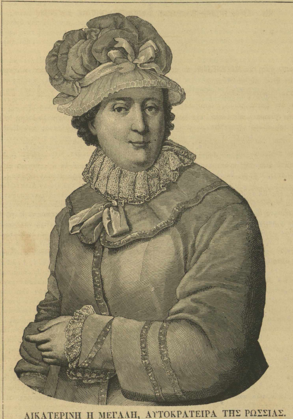
ΑΙΚΑΤΕΡΙΝΗ Η ΜΕΓΑΛΗ, ΑΥΤΟΚΡΑΤΕΙΡΑ ΤΗΣ ΡΩΣΣΙΑΣ.

ΑΝΑΓΝΩΣΜΑ ΟΙΚΟΓΕΝΕΙΑΚΟΝ ΠΕΡΙΟΔΙΚΩΣ ΕΚΔΙΔΟΜΕΝΟΝ.