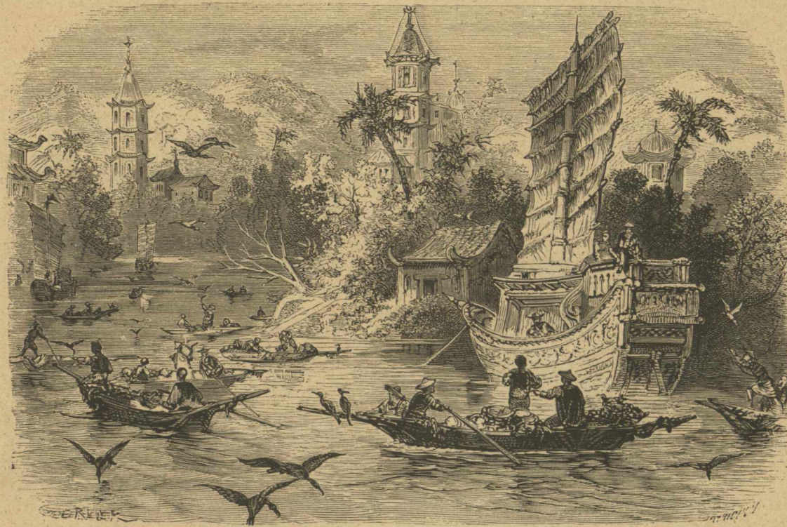
Ἄλιεῖα ἐν Κίνα διὰ φαλακροκόρακων.

μαρτυρούσας ὅτι τοῦτο ἐπεσκευάσθη ὑπὸ ἀδεξιάς χειρὸς. Ὡσαύτως δὲ μεταξὺ τῶν πέριξ τοῦ Ὀρφέως θηρίων, εἰς κάπρος καὶ μία ἕλαφος τοσοῦτον ἐλαττοῦνται κατὰ τὸ σχέδιον, ὥστε δὲν δύναται τις νὰ τα δεχθῆ ὡς ἐνὸς καὶ τοῦ αὐτοῦ ζωγράφου. Δεξιὰ δὲ καὶ ἀριστερὰ εἶνε τὰ μικρότερα χωρίσματα, περιβαλλόμενα ὑπὸ περιθωρίων πολυφύλλων, ἐξ ὧν κρίνεται εἶδος μεταλλίου, ἐφ' οὗ εἶνε μορφή ἀνθρωπίνη, καὶ πτηνὰ παντοῖα παίζουσιν ἐν τῷ μέσῳ θελκτικωτάτου τοπείου. Ὅλη δὲ ἡ εἰκὼν περιβάλλεται ὑπὸ περιπλο-